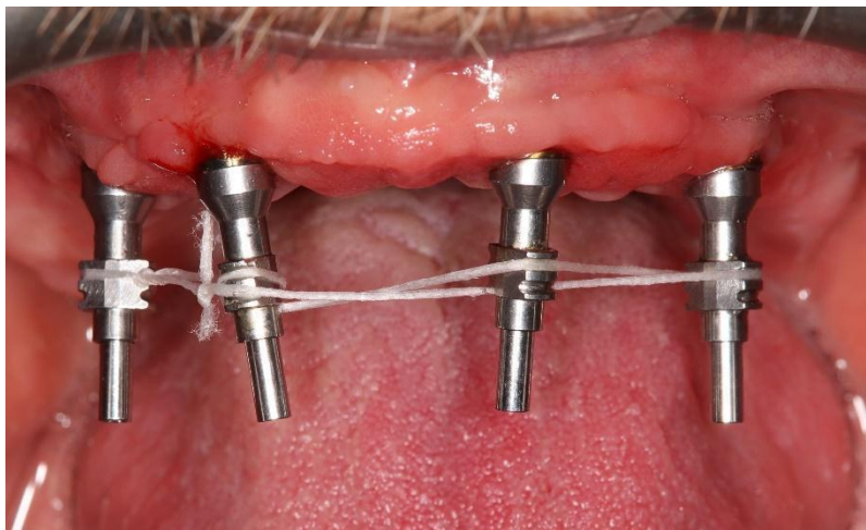
Slika 3. Povezivanje transfera koncem kao baza za autoakrilat

Povezivanje transfera provodi se kako bi se spriječio pomak svakoga pojedinog transfera u elastičnom otisnom materijalu. Povezani transferi u usporedbi s nepovezanim transferima pokazuju veću preciznost položaja implantata tijekom otiskivanja (14).