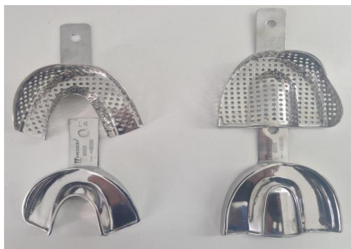
Slika 1. Konfekcijske žlice za otiske

Konfekcijske žlice za otiskivanje (Slika 1) metalne su žlice. Za mehaničku retenciju otisne mase imaju zadebljani rub ( rimlock ) ili perforacije. Podijeliti se mogu na žlice za gornju i donju čeljust, ozublenu, djelomično ozublenu ili bezubu čeljust. Da bi se žlica smatrala odgovarajućom potrebno je da udaljenost ruba žlice i zubnoga luka iznosi 3 – 5 mm (3).