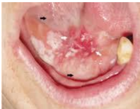
Slika 6. Eritroplakija. Preuzeto: (20)

noći. Rizik za eritroplakiju je veći među povremenim pušačima nego bivšim pušačima. Rizik je veći za one koji konzumiraju više cigareta dnevno (19).