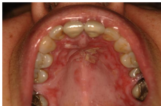
Slika 2. Oslabljena sluznica nakon ispiranja s rakijom, koloidnim srebrom i kaduljom.