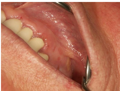
Slika 1. Erozijske promjene sluznice nakon primjene Tincture adstringens .

Važno je napomenuti da neki čajevi (poput kadulje- Calendula officinalis ), biljni proizvodi ( Tinctura adstringens ) i antiseptičke otopine mogu dovesti do oštećenja sluznice. U Hrvatskoj je vrlo popularan propolis koji se koristi za različita oralna stanja i bolesti. Međutim, vrlo česta upotreba može dovesti do neželjenih učinaka u usnoj šupljini, koji uglavnom nastaju zbog alkohola koji se nalazi u tim pripravcima. Propolis kao smola se topi samo u alkoholnim otopinama. Drugi česti domaći pripravak za oralnu primjenu kao antiseptik je rakija, koja također dovodi do oštećenja sluznice (7).