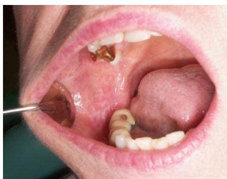
Slika 10. Lihenoidna reakcija na alendronat. Preuzeto: (7)

Nastanak lihenoidne reakcije u usnoj šupljini na lijekove ima varijabilan period latencije koji može trajati od nekoliko tjedana do nekoliko godina od početka uzimanja lijeka. Vjerojatno nastanak lihenoidne reakcije ovisi o mnogim faktorima poput tipa lijeka, doze, prijašnje ekspozicije lijeku. Danas se smatra da nesteroidni protu-upalni analgetici najčešće dovode do nastanke promjena. Isto tako je poznato kako fenotijazini, suflnamidi, tijazidni diuretici, antibiotici, antimalarici, zlato, antifungici, antiretroviralni lijekovi također mogu dovesti do pojave lihenoidne reakcije. Mehanizam po kojem nastupaju ovakve promjene nije u potpunosti poznat. Histopatološki nalaz nije specifičan. Najpouzdaniji dokaz je nestanak lihenoidne reakcije nakon prestanka korištenja lijeka i povratak lezija nakon ponovnog uzimanja lijeka. No, to je teško izvodljivo zbog opasnosti od pojave anafilaktičke reakcije. Kliničko prepoznavanje lihenoidne reakcije se temelji na subjektivnim kriterijima, pri čemu postoji određena sklonost unilateralnom pojavljivanju lezija (7, 8, 10).