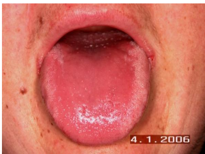
Slika 14. Atrofična kandidijaza uslijed antibiotika. Preuzeto: (7)

Kandida je prisutna kao oralni komenzal u 50-70% populacije. Infekcija nastaje kod sistemnih poremećaja, imunoloških, posebno imunodeficientnih stanja. Kandidijazi pogoduje uzimanje lijekova kao što su antibiotici, kortikosteroidi, citotoksični lijekovi i drugi imunosupresivi. Također lijekovi koji dovode do nastanka kserostomije pogoduju nastanku kandidijaze (atrofične ili pseudomembranozne) ( 7, 10, 11).