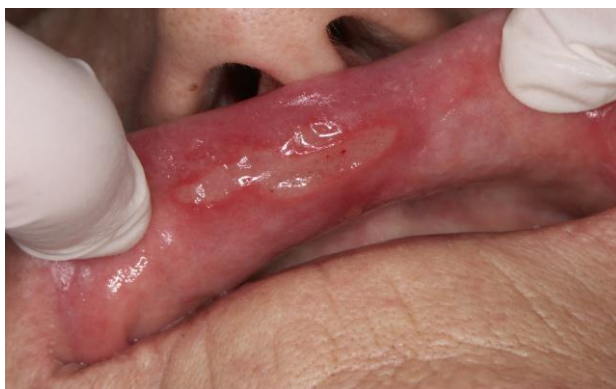
Slika 3. Ulceracija nakon uzimanja ginka. Preuzeto: (7)

Ponekad je teško dijagnosticirati što je pravi uzrok oralnim ulceracijama, posebno kod imunodeficijentnih pacijenata i onih koji uzimaju puno lijekova. Ulceracije mogu biti uzrokovane: 1) traumom, 2) mikrobima (bakterije, virusi, gljive), 3) autoimunim bolestima (kao što su recidivirajuće afte), 4) sistemnim bolestima (gastrointestinalne poput Crohnove bolesti i hematopoetskih kao što je neutropenija), 5) vezikulo-buloznim bolestima (pemfigus i pemfigoid), 6) malignim promjenama, 7) bulimijom, 8) nuspojavama na lijekove i dr. Etiopatogeneza nastanka ulceracija zbog lijekova nije razjašnjena u potpunosti. Zna se da nesteroidni protuupalni lijekovi i beta blokatori mogu dovesti do nastanka oralnih ulceracija. U literaturi je opisano kako beta blokatori poput kaptoprila, alendronata, nikorandila, ali i inhibitori proteaza i sulfonamidi mogu dovesti do nastanka promjena. Dalje, tu se nalazi natrij lauril sulfat, koji je sastojak većine zubnih pasta. Ulceracije mogu nastati kao nuspojava imunosupresivne terapije. Naime, imunosupresivi mogu dovesti do aktiviranja infekcije herpes virusima ili nekim drugim poput citomegalovirusa koji se manifestiraju kao ulceracije. Lijekovi poput fenilbutazona, dovode do agranulocitoze, pa samim time i do nastanka ulceracija (7, 8, 11, 17).