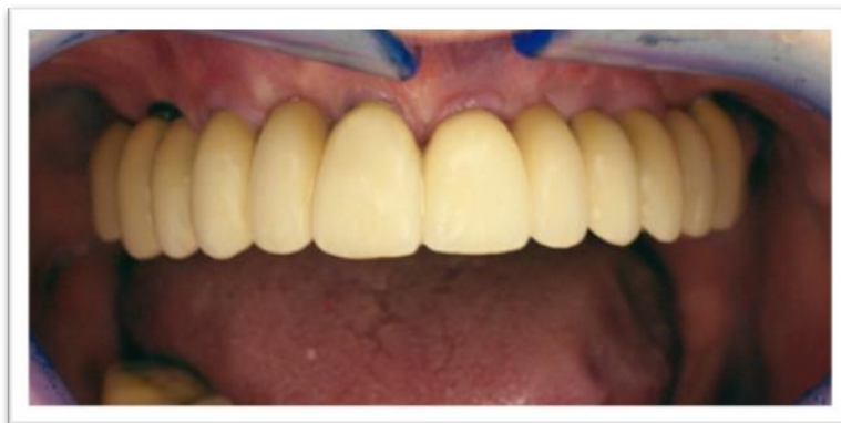
Slika 1. FP1 suprastruktura na implantatima. Preuzeto: (8)

FP2 nadoknađuje krunu i dio korijena pri čemu je gingivalna trećina nadomjesnog zuba produžena (Slika 2.). Važan čimbenik je linija osmijeha koja bi u ovom slučaju trebala biti niže položena, tj. pri osmijehu se ne ni trebao vidjeti gingivalni dio (7).