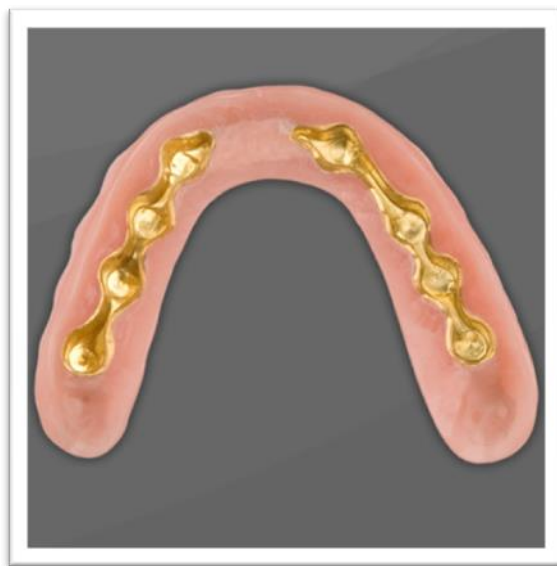
Slika 4. Mobilna proteza poduprta implantatima, bazalni pogled.

RP5 je mobilna proteza s kombiniranim opterećenjem (Slika 5.). Ovisno o broju i rasporedu implantata, primarno opterećenje je na mekom tkivu, a retencija je poboljšana implantatima ili implantati podupiru prednji segment proteze, dok meko tkivo stražnji. Broj potrebnih implantata je varijabilan. Bitna prednost je cijena, s obzirom na manji broj potrebnih implantata, ali dolazi do dva do tri puta brže resorpcije alveolarnog grebena u usporedbi s potpunim protezama. Pokrovna proteza retinirana dvama implantatima postala je standardna terapija rehabilitacije donje čeljusti (7).