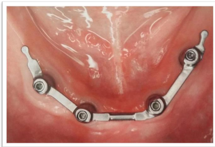
Slika 11. Prečka na implantatima. Preuzeto: (1)