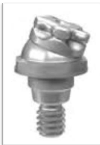
Slika 9. SFI sidro. Preuzeto: (18)

SFI sidro dostupno je samo za Straumann implantate. Navedeno spojno sredstvo kompenzira divergenciju osi implantata do 60^\circ (Slika 9.). Retencijski elementi imaju oblik zvijezde i umetnuti su u matricu. Dostupni su u četiri stupnja retencije: žuta (vrlo slaba), crvena (slaba), zelena (srednja), plava (jaka). Za divergenciju do 20^\circ koristi se jednodijelni kruti sekundarni dio D20, dok za divergenciju veću od 20^\circ sekundarni dio D60, koji se prilagođava u ustima te cementira postavljen u idealnom smjeru (1).