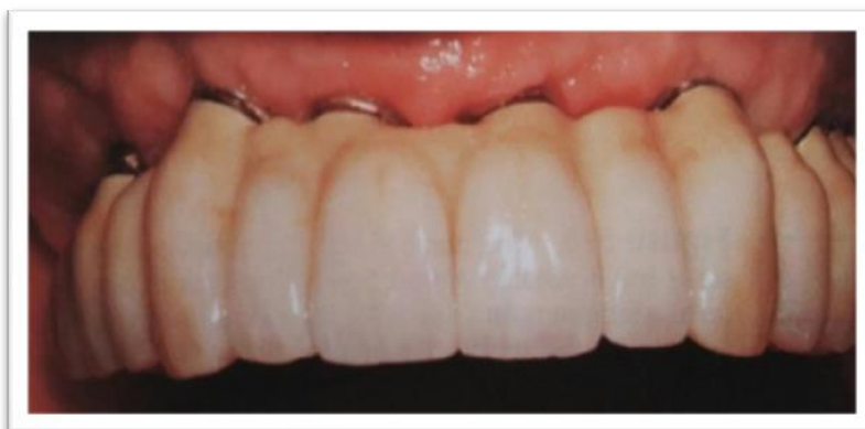
Slika 2. FP2 suprastruktura na implantatima. Preuzeto: (7)

FP2 nadoknađuje krunu i dio korijena pri čemu je gingivalna trećina nadomjesnog zuba produžena (Slika 2.). Važan čimbenik je linija osmijeha koja bi u ovom slučaju trebala biti niže položena, tj. pri osmijehu se ne ni trebao vidjeti gingivalni dio (7).