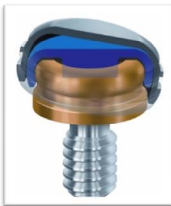
Slika 8. Lokator.

Lokator se, također, sastoji od patrice i matrice, što je prikazano na slici 8. Patrica se pričvršćuje na implantat definitivnim okretnim momentom, dok je matrica polimerizirana u protezu i sadrži najlonski retencijski umetak. Umetci su zamjenjivi i dijele se u dvije skupine: za implantate nagiba osi do 10^\circ koji sadrže središnji cilindar te ostvaruju dvostruku retenciju (22N-prozirna, 13N- ružičasta, 7N-plava) i na one više od 10^\circ bez cilindra (7N-crvena, 18N-zelena). Nagib implantata provjerava se pomoću nastavaka za određivanje kuta i kutomjera. Lokatori dozvoljavaju odstupanje paralelnosti do 40^\circ . Visina lokatora iznosi 2,4 mm. Primjenjiv je za različite visine implantantne nadogradnje, odnosno različite stupnjeve resorpcije kosti. Prvenstveno im je cilj povećati retenciju i stabilizaciju pokrovne proteze na implantatima, a ne prijenos opterećenja. Reduciranje proteze nije preporučljivo (1).