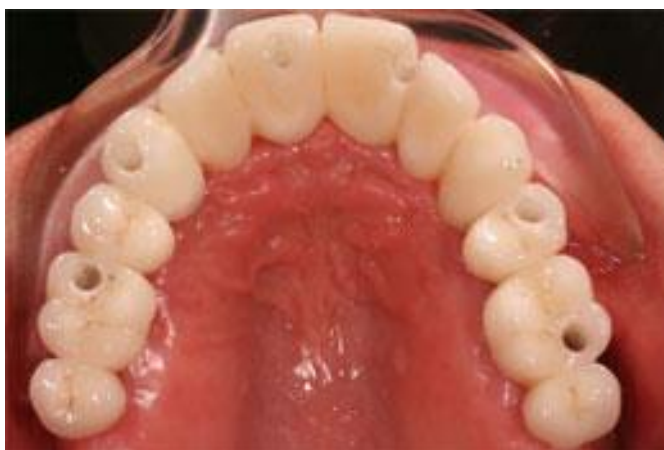
Slika 6. Fiksna suprastruktura vijačno pričvršćena.

nego kod cementiranja. Veća je učestalost pucanja keramike, posebno kada se vijak nalazi blizu okluzalne plohe. Teže je usklađivanje okluzije brušenjem. Vijci s vremenom popuštaju pa ih je potrebno zatezati (1, 2).