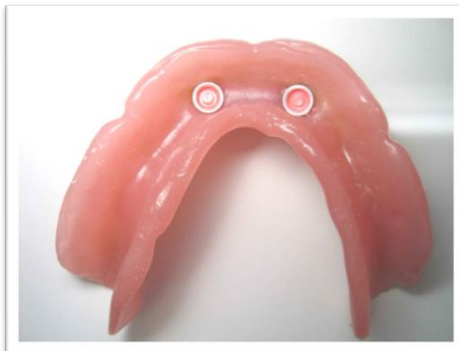
Slika 5. Mobilna proteza s kombiniranim opterećenjem, bazalni pogled.

Bez obzira na vrstu opterećenja, mobilne proteze na implantatima mogu biti konvencionalne, reducirane (bez nepca) i skeletirane (most na skidanje). Ovisno o anatomskim uvjetima, stanju kosti i mekog tkiva, liniji osmjeha, željama pacijenta, odabiremo najprikladniji nadomjestak. Što je veća površina proteze podruprta implantatima, bazu je dozvoljeno više reducirati.