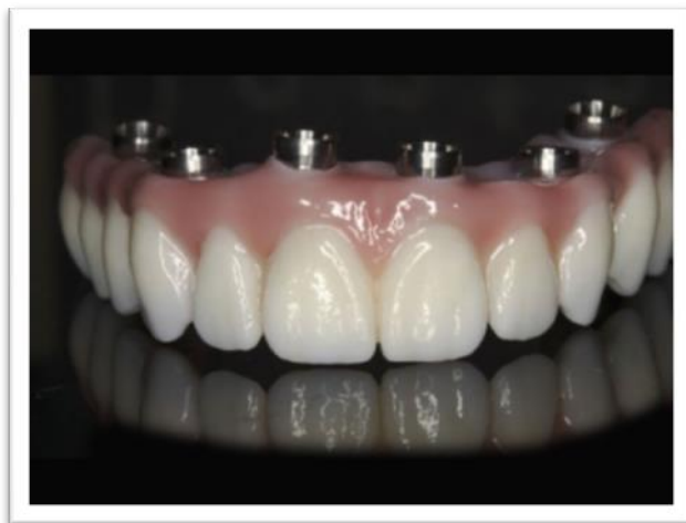
Slika 3. FP3 suprastruktura. Preuzeto: (10)