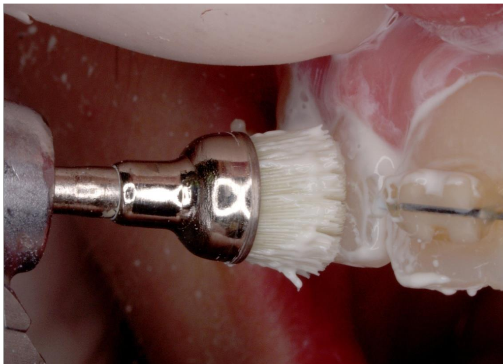
Slika 12. Završno poliranje estetske rekonstrukcije.

Tijekom cijelog postupka obrade pacijentica je kontrolom pomoću velikog zrcala izražavala svoje želje o završnom izgledu zuba. Kada je završen kompletan postupak, pristupilo se kontroli napravljenog rada. Pomoću sonde i ogledala prekontrolirani su svi prijelazi između nadogradnje i zuba te se pomoću zubnoga konca provjerilo stanje u području aproksimalnih površina. Po završnoj kontroli pacijentica je upućena ortodontu radi nastavljanja i završetka provedbe ortodonske terapije. S pacijenticom je dogovoren kontrolni pregled nakon završetka ortodonske terapije, pri čemu bi se dogovorio završni postupak. Pacijentica je trenutno izuzetno zadovoljna s izrađenom nadogradnjom te je izrazila želju da, ukoliko ne mora, ne bi provodila daljnje rekonstruktivne zahvate koji bi obuhvaćali dodatno brušenje zuba i fiksno-protetsku opskrbu. Na slikama 13 i 14 prikazan je završni izgled estetske rekonstrukcije.