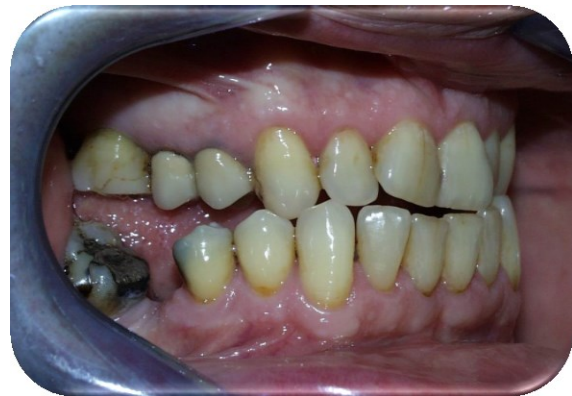
Slika 4. Bukalno nagnuti donji kutnjaci uslijed makroglosije. Tete â tete zagriz.