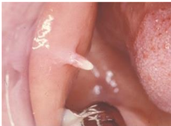
Slika 9. Condyloma acuminatum. Preuzeto iz: Testi D, Nardone M, Melone P, Cardelli P, Ottria L, Arcuri C. HPV and oral lesions: preventive possibilities, vaccines and early diagnosis of malignant lesions. Oral Implantol (Rome) . 2016;8(2-3):45-51. This work is licensed under a Creative Commons Attribution-NonCommercial-NoDerivatives 4.0 International License.