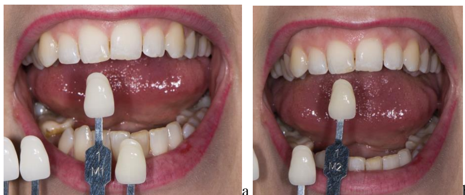
Slika 11. Postupak određivanja boje prirodnog zuba 3D Master linearnim ključem boja. a - svjetlina 1, srednja, slabije zasićena nijansa odgovara boji promatranog zuba; b - svjetlina 1, srednja, jače zasićena nijansa ne odgovara boji promatranog zuba