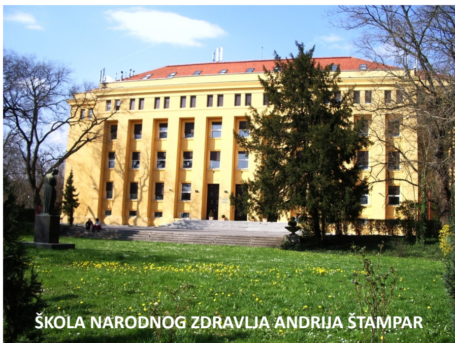
ŠKOLA NARODNOG ZDRAVLJA ANDRIJA ŠTAMPAR

Svjetska stomatološka organizacija (FDI) svake godine 20. ožujka obilježava Svjetski dan zdravlja usne šupljine kako bi upozorila na značenje oralnoga zdravlja. Ove godine održan je pod geslom Tu sve počinje; zdrava usta; zdravo tijelo! I jasno, ponovno su u svim prigodnim akcijama sudjelovali stručnjaci i studenti Stomatološkoga fakulteta Sveučilišta u Zagrebu.