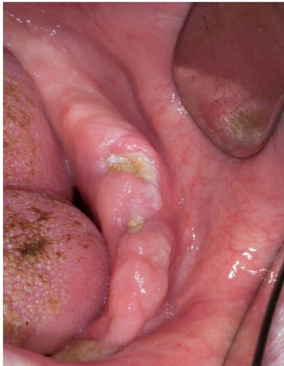
Slika 3. Ulceracija uzrokovana osteoradionekrozom u području mandibule.