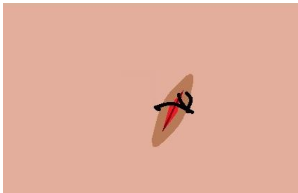
Slika 1. – Prikaz jednostavnog pojedinačnog šava