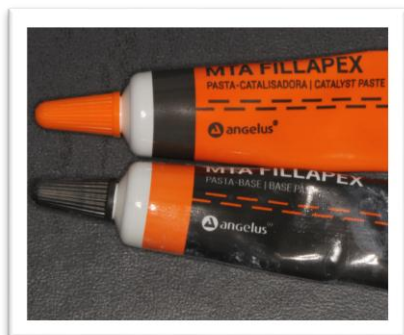
Slika 1. MTA