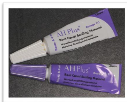
Slika 2. AH Plus