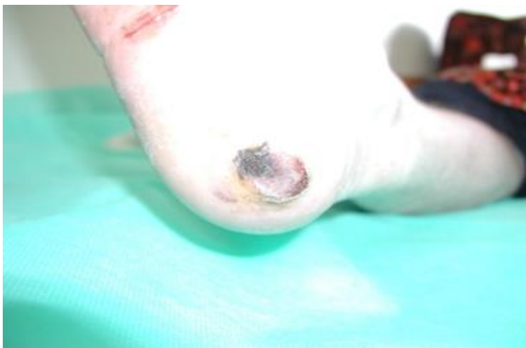
Slika 18. Akrolentiginozni melanom

radijalne faze rasta u vertikalnu i stvara se tumor (slika 18). Poseban oblik ALM-a je subungvalni melanom koji se razvija na ležištu nokta (4).