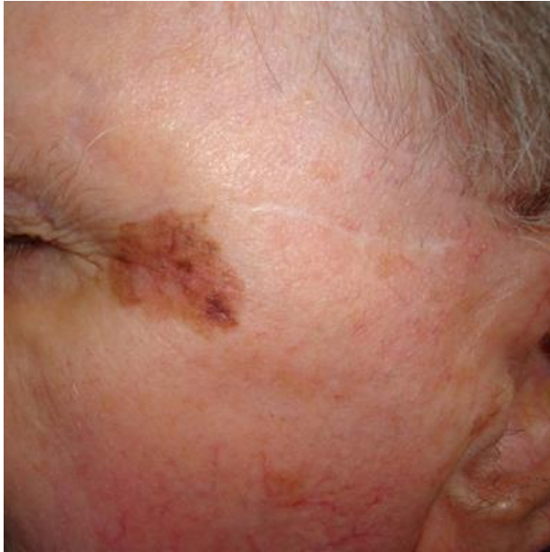
Slika 17. Lentigo maligni melanom