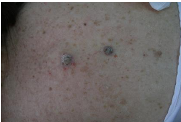
Slika 13. Egzofitični spinocelularni karcinomi