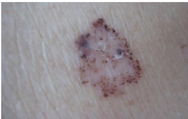
Slika 11. Pigmentirani površinski BCC