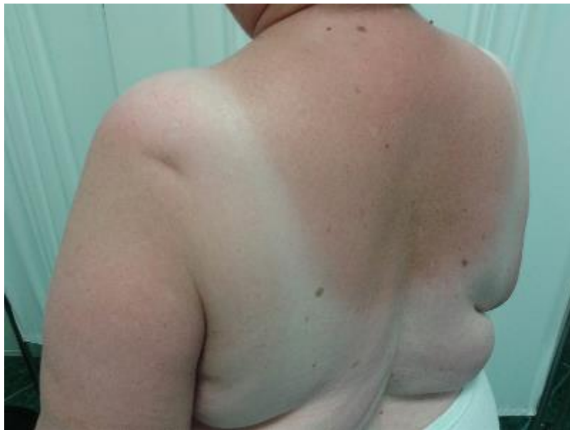
Slika 4. Fotoalergijski dermatitis (eritem kod bolesnice koja uzima klorotiazid nakon izlaganja kože UV zračenju)

mehanizmi. Pod utjecajem svjetla fotosenzibilizator se aktivira, spaja se s proteinima kože i postaje antigen, nakon čega slijedi uključenje imunoloških mehanizama i pojava patoloških promjena na koži. Lijekovi koji uzrokuju fotoalergijske reakcije mogu biti primijenjeni lokalno, kao što su fentiklor i buklosamid (antimikotici), te peroralno: tetraciklini, sulfonamidi, sulfonilureja (antidijabetik), fenotiazin (psihofarmak), triprolidin (antihistaminik), klorotiazid (diuretik) (slika 4) (6).