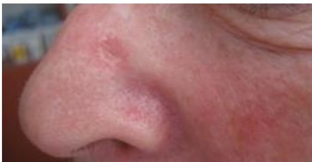
Slika 10. Sklerozirajući BCC

bazocelularnog karcinoma te kao recidivi metatipičnog oblika bazocelularnog karcinoma (6, 7).