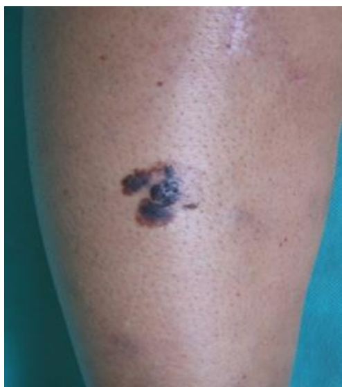
Slika 15. Površinsko šireći melanom (SSM)

SSM se najčešće razvija iz postojećih pigmentiranih lezija. Granice prethodno pravilnog oblika postaju nepravilne s nazubljenim rubovima. Tijekom radijalne faze rasta, SSM je ravna lezija svijetlosmeđe do crne boje (slika 15). U vertikalnoj fazi rasta površina SSM-a je neravna i bradavičasta. SSM se može pojaviti na koži bilo kojeg dijela tijela, međutim, postoje lokalizacije na kojima se pojavljuje nešto češće, kao što su noge u žena te leđa u muškaraca (7).