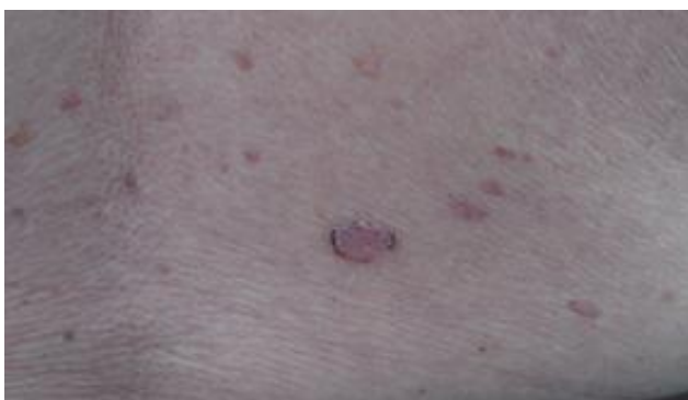
Slika 12. Površinski BCC