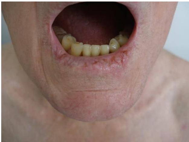
Slika 14. Infiltrirajući spinocelularni karcinom na lijevoj strani donje usnice, aktinički heilitis donje usnice

SCC na usnicama se može razviti iz leukoplakije ili aktiničkog heilitisa. U 90% slučajeva SCC se razvije na donjem rubu usnice (slika 14).