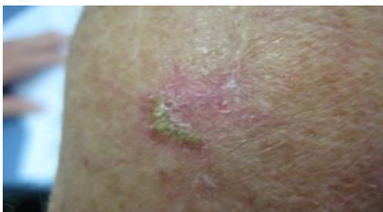
Slika 6. Eritematozno- keratotična aktinička keratoza

Aktiničke keratoze pojavljuju se na fotoekspoziranim dijelovima kože i očituju se kao okrugle ili ovalne crvenkastosmeđe promjene, obično oštro ograničene, veličine 0,5-2 cm, hrapave površine, ponekad prekrivene adherentnim ljuskama. Klinički, postoji više oblika aktiničkih keratoza; eritematozna ili atrofična (slika 6), keratotična (slika 7), keratoza poput lihena te pigmentirana. Važno je naglasiti da aktinički heilitis, oblik aktiničke keratoze lokaliziran uglavnom na donjoj usnici, nosi veći rizik za zloćudnu preobrazbu odnosno progresiju u invazivni planocelularni karcinom (7).