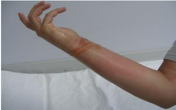
Slika 3. Fitofotodermatitis