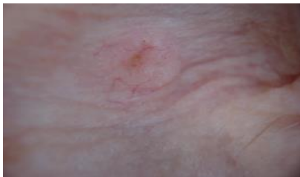
Slika 8. Nodularni BCC