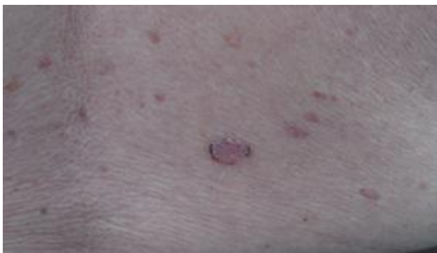
Slika 12. Površinski BCC