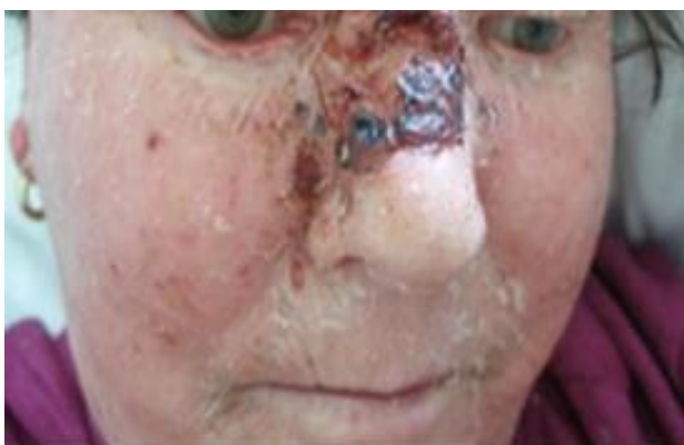
Slika 9. Ulcerozni BCC (ulcus rodens)