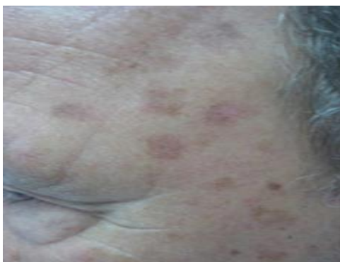
Slika 7. Multiple pigmentirane aktiničke keratoze