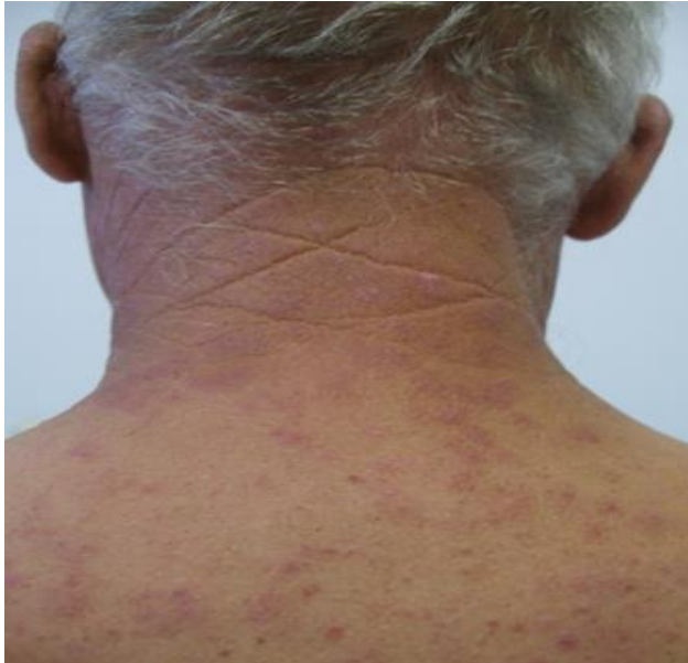
Slika 5. Fotostarenje kože (cutis rhomboidalis nuchae)

uočavaju karakteristične duboke brazde kože (slika 5). U preinvazivne tj. zloćudne promjene koje se mogu javiti na koži ubrajaju se aktiničke keratoze, bazocelularni i spinocelularni karcinom i melanom te aktinički heilitis na usnicama.