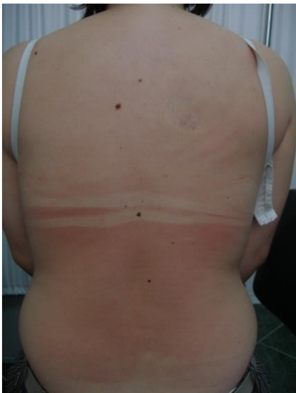
Slika 2. Solarni dermatitis (opekline od sunca)

Eritem se razvija nakon 6 sati na fotoekspoziranom području, a vezikule nakon 24 sata (slika 2). Često su prisutni i opći simptomi poput glavobolje, povišene tjelesne temperature, malaksalosti i slabosti. Kako edem i eritem blijede, vezikule i bule pucaju i nastaju kruste. Kao trajna posljedica teških opekline mogu se razviti depigmentacije kao posljedica destrukcije melanocita te hiperpigmentacije poput solarnog lentiga. Kod istodobnog snažnog pregrijavanja kože i prekoračenja mehanizma termoregulacije dolazi do pregrijavanja organizma i toplinskog šoka (4).