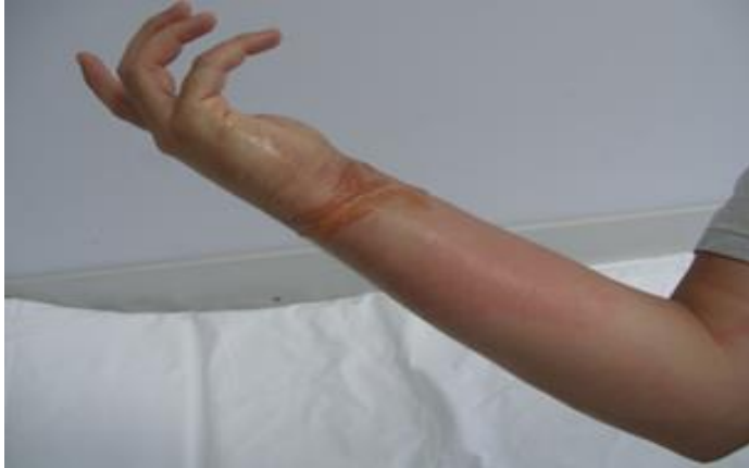
Slika 3. Fitofotodermatitis