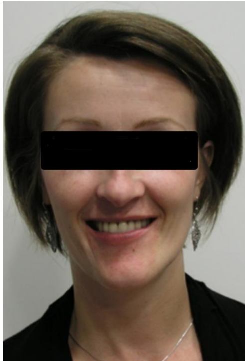
Slika 3. Pacijentica nakon ortognatsko kirurškog zahvata.