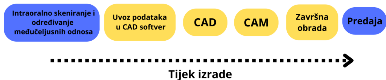
Slika 3. Prikaz potpuno digitaliziranog tijeka rada u postupku izrade okluzijske udlage (plavo – kliničke faze, žuto – laboratorijske faze)

Doktor dentalne medicine predaje okluzijsku udlagu pacijentu, a prije toga izvodi sve one provjere koje su ranije opisane kod postupka konvencionalne izrade.