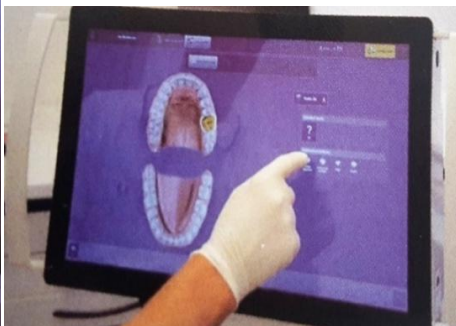
Slika 19. Skeniranje u ustima pacijenta i obilježavanje ruba preparacije. Preuzeto: (22)