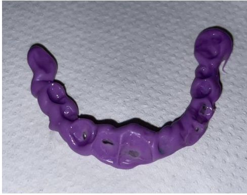
Slika 7. Međučeljusni registrat.