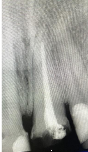
Slika 1. Neadekvatno napunjen korijenski kanal zuba 21.