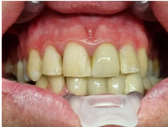
Slika 8. Proba krunice.