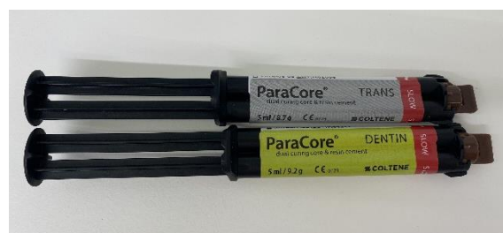
Slika 3. ParaCore cement