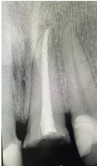
Slika 2. Revizija punjenja zuba 21.