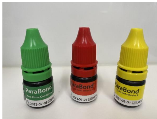
Slika 2. ParaBond