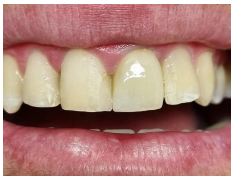
Slika 9. Cementirana krunica.