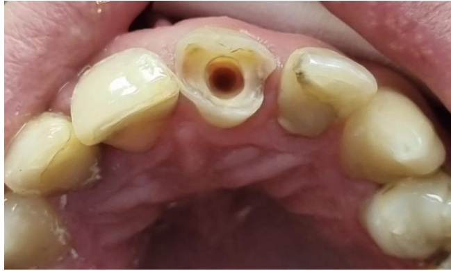
Slika 3. Preparacija zuba 21 za konfekcijsku nadogradnju.