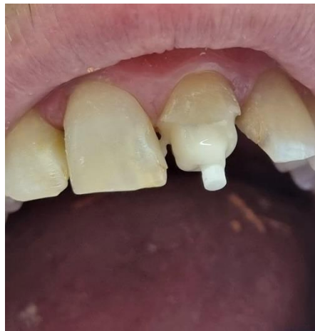
Slika 4. Postavljanje konfekcije nadogradnje.