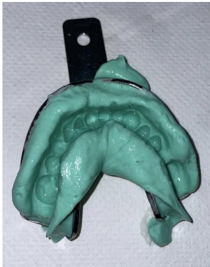
Slika 5. Otisak donje čeljusti.