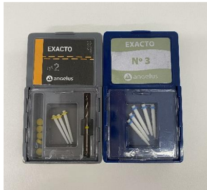
Slika 1. konfekcijski intrakanalni kolčići ojačani vlaknima

se vlakna ne razdvajaju pri rukovanju (17). Nedostaci ovih kolčića su njihova visoka cijena koja je ograničavajući čimbenik njihove svakodnevne upotrebe.