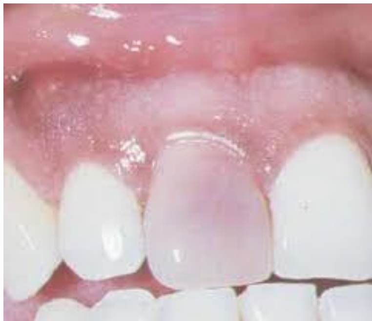
Slika 3: Diskoloracija krune centralnog maksilarnog sjekutića uslijed pulpne nekroze. Preuzeto: (22)