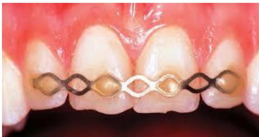
Slika 2: TTS. Preuzeto: (18)