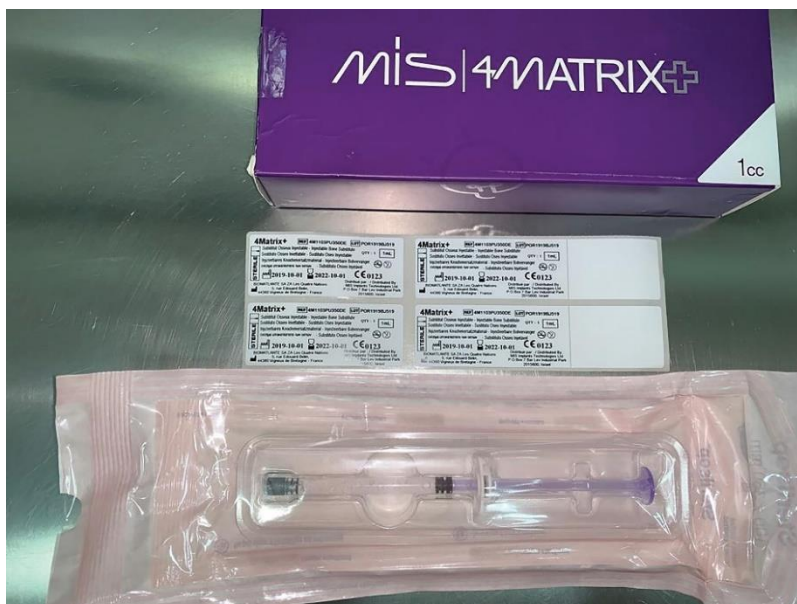
Slika 2. Koštani nadomjesni materijal sastavljen od \beta -trikalcijevog fosfata (40%), hidroksiapatita (60%) i hidrogela (4MATRIX+, MIS Implants)

Sintetski hidroksiapatit može se dobiti precipitacijom kalcijevog nitrata i amonijevog dihidrogenfosfata. Mehanička svojstva su bolja u odnosu na \beta -trikalcijev fosfat, no potrebno mu je više vremena za resorpciju, stoga su proizvedeni preparati koji sadržavaju različite omjere \beta -trikalcijevog fosfata i hidroksiapatita ili dvofazni kalcij fosfati (Slika 2. i 3.).