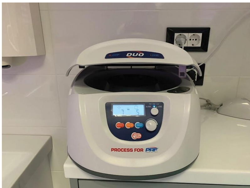
Slika 1. Stolna centrifuga za pripremu PRF-a

PRF razvijen od strane Choukrouna i sur., takozvani L-PRF (engl. leukocyte PRF ) centrifugiran je na višim vrijednostima okretaja u minuti. Istraživanjima je ustanovljeno da će smanjenje broja okretaja centrifugiranja dovesti do povećanja broja stanica i pod tom pretpostavkom razvijen je A-PRF (engl. advanced PRF ). A-PRF protokol odvija se pri otprilike 1500 okretaja u minuti tijekom 14 minuta. Upotrebom ovog protokola utvrđen je povećan broj trombocita, limfocita i neutrofila što dovodi i do povećane diferencijacije makrofaga koji su odgovorni i za diferencijaciju osteoblasta. Još jedna vrsta PRF-a je I-PRF ili injekcijski PRF. Za razliku od PRP-a koji postoji i u obliku tekućine, PRF je postojao isključivo u obliku gela iz čega proizlazi da se nije mogao injicirati. I-PRF centrifugira se na 700 okretaja u minuti tijekom 3 minute. Koriste se plastične epruvete koje ne dovode do aktivnog procesa koagulacije što omogućuje da se nakon nekoliko minuta centrifugiranja PRF lako aspirira i primjenjuje injiciranjem (20).