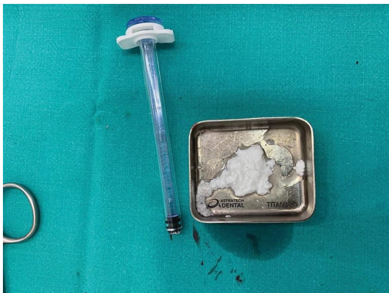
Slika 3. Materijal (4MATRIX+, MIS Implants) pomiješan s fiziološkom otopinom i spreman za primjenu