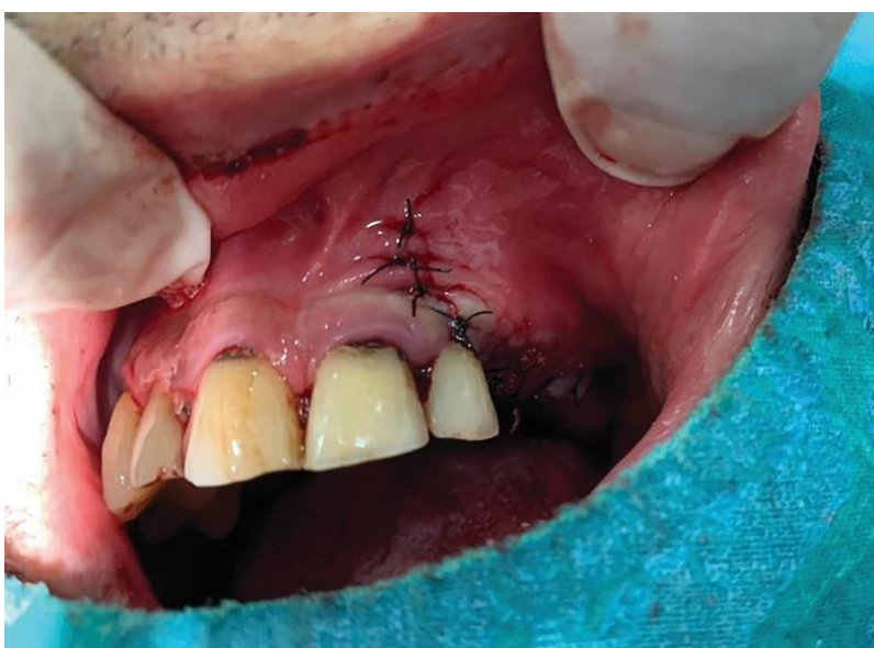
Slika 7. Poticanje primarnog cijeljenja rane nakon augmentacije grebena šivanjem

Troeltsch i sur. istraživanjem učinkovitosti nadomjesnih materijala u lateralnoj i vertikalnoj augmentaciji zaključuju kako se značajno poboljšanje u vertikalnoj dimenziji može postići