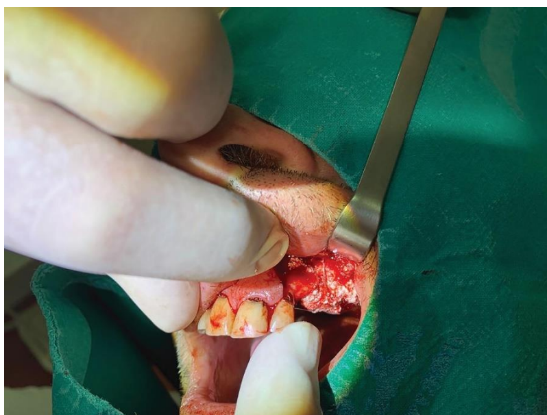
Slika 5. Augmentacija grebena primjenom aloplastičnog materijala (4MATRIX+, MIS Implants)