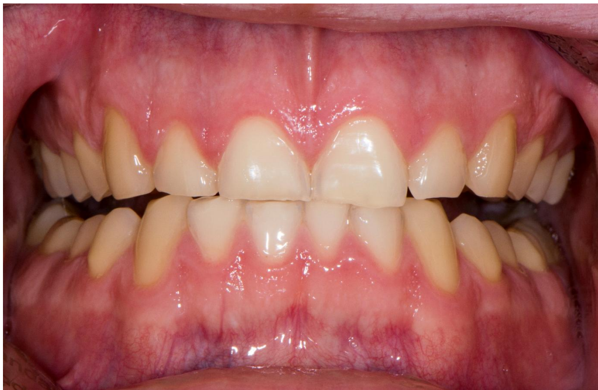
Slika 1. Atricija gornjih inciziva. Preuzeto s dopuštanjem autora: prof. dr. sc. Iva Alajbeg