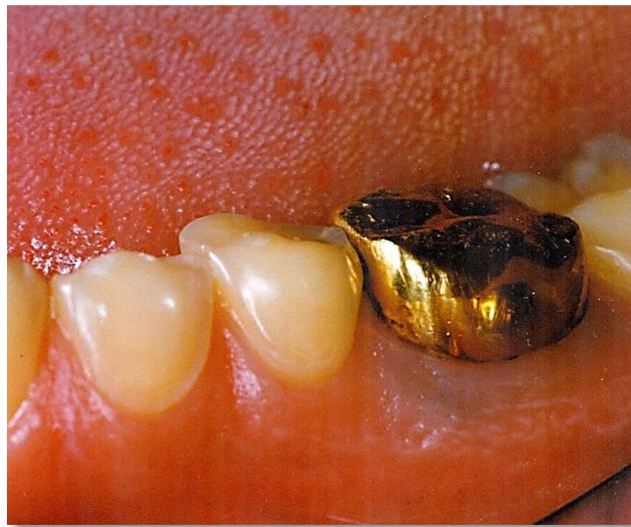
Slika 5. Nesrazmjer u veličini zlatne krunice i okolnih erodiranih zubi koji su cjelini smanjeni.