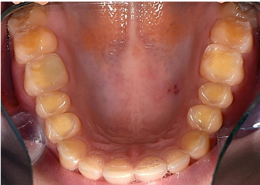
Slika 3. Okluzalni izgled gornjih zubi. Vidljiv je izražen gubitak okluzalne cakline i caklinsko-dentinsko spojiše.