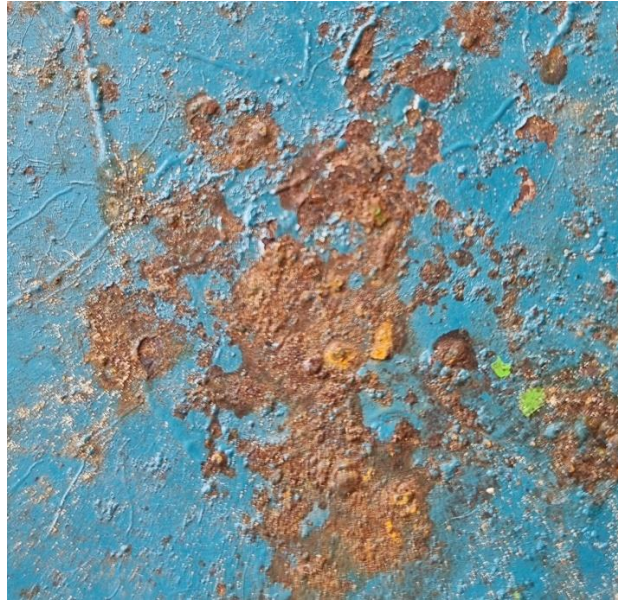
Slika 1. Taloženje površinskih oksida uslijed kemijskog korodiranja metala.

Elektrokemijska korozija događa se u vlažnim medijima, tj. elektrolitima, a usna šupljina kao vlažan medij gdje slina djeluje kao elektrolit ima izniman potencijal za korodiranje. Korozija u usnoj šupljini započinje kad su prisutna dva metala različitih elektrokemijskih potencijala (Slika 2.), no kritična točka pri kojoj počinje otpuštanje iona metala u elektrolit ovisi o nekoliko faktora, a to su: vrsta aniona i njegova koncentracija u elektrolitu i broj elektrona na površini legure. Tada se događa otapanje iona s mjesta manje plemenitosti prema većoj. U usnoj šupljini nastaju 2 zaštitna sloja na površini legure, oksidni i sulfidni sloj. Sulfidni sloj nastaje kao reakcija između sumpora iz hrane i pića i legure, te izaziva diskoloraciju legure. Stvaranje zaštitnog sloja na površini legure nije uvjet za zaustavljanje korozijske aktivnosti u usnoj šupljini (10).