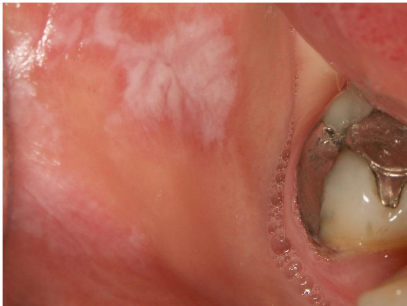
Slika 4. Hiperkeratotične promjene sluznice usne šupljine u dodiru s amalgamskim ispunom.

amalgama, prvenstveno mislimo na toksičnost žive. Ona se u sastavu dentalnih amalgama pojavljuje kao elementarna, a u ljudski organizam ne ulazi nužno iz dentalnih ispuna, već su joj ljudi mnogo više izloženi putem hrane, naročito tune, zraka, kozmetičkih preparata i industrije. Utjecaj žive na organizam može biti lokalni ili sustavni jer je ona lipofilna i prolazi kroz krvno-moždanu barijeru, posteljicu i mliječnu žlijezdu. Iz amalgamskih ispuna sastojci se mogu oslobađati u obliku živih para, amalgamskih čestica i korozivskih proizvoda. Većina tih iona odlazi u usnu šupljinu, a samo mali dio ulazi u korodirani amalgamski ispun gdje pečati rubne pukotine ili stvara površinski zaštitni sloj. Lokalni utjecaj žive podrazumijeva njezin utjecaj na pulpu, sluznicu usne šupljine i parodont, a sustavni utjecaj na bubrege, živčani, krvožilni, imunološki i probavni sustav. U usnoj šupljini može izazvati različite promjene, metalni okus, pojačanu salivaciju, oralne ulceracije ili hiperkeratoze dijela sluznice usne šupljine koje su u kontaktu s amalgamom poznate kao lihenoidna reakcija (Slika 4.) koja se povlači kroz mjesec dana nakon zamjene ispuna, pa čak i alergijsku reakciju tip IV, no češća je pojava kratkotrajnog kontaktnog alergijskog dermatitisa na licu i vanjskim stranama udova (10).