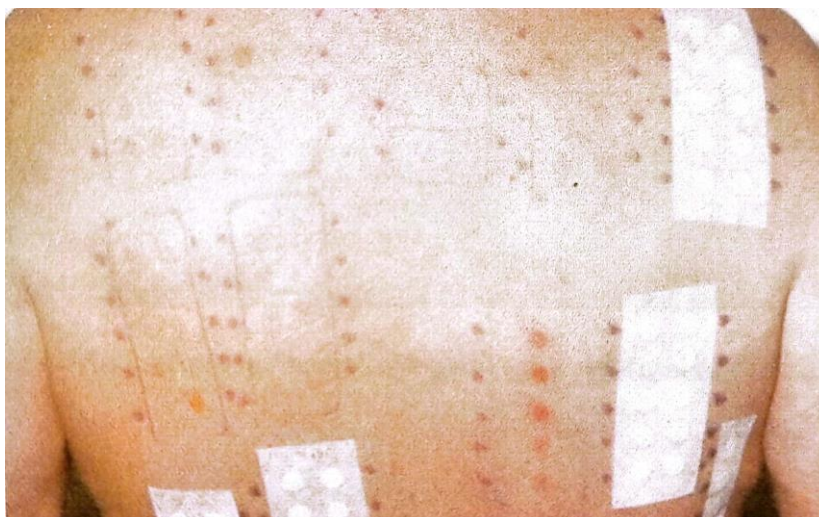
Slika 5. Epikutano ili patch testiranje. [Preuzeto s dopuštanjem prof. dr. sc. Ketij Mehulić].