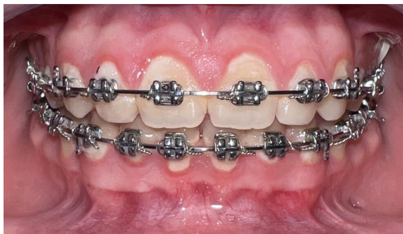
Slika 3. Hipertrofija gingive uzrokovana lošom oralnom higijenom tijekom ortodontske terapije.

Inicijalna karijesna lezija ili bijela mrlja definirana je kao površinska i/ili ispodpovršinska demineralizacija cakline bez prisutnosti kavitacije, početni je oblik karijesnog procesa s mogućnošću remineralizacije (34,35). Bijele mrlje razvijaju se na površini zuba kao posljedica produljenog i neometanog nakupljanja plaka uzrokovanog nepravilnom oralnom higijenom (Slika 3 i 5). U takvim uvjetima kiseline difundiraju u dublje dijelove i dovode do demineralizacije ispodpovršinske cakline. Ako se napredovanje karijesnog procesa ne zaustavi, lezija će kavitirati i neće se moći remineralizirati (36). Inicijalne lezije najčešće se nalaze na glatkim plohama zuba, u fisurama i jamicama, a karakterizira ih mliječno bijela, opakna promjena na caklini vidljiva nakon produljenog sušenja zrakom (37). Zbog smanjenja minerala u caklini ona postaje manje translucetna i mijenja se refraktorni indeks cakline. Kada su poroznosti u caklini ispunjene vodom, slabije se uočavaju nego kad se osuše. No, napredovanjem karijesa cakline nije potrebno sušiti površinu kako bi se uočila bjelkasta područja. Ako je karijesna lezija vidljiva samo nakon sušenja, smatra se da je karijes zahvatio samo vanjsku polovinu cakline. Ako je opacitet vidljiv i bez sušenja, karijesnim procesom zahvaćena je cijela caklina i vanjski dio dentina (6,38,39).