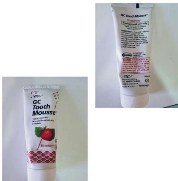
Slika 6. GC Tooth Mousse, topikalni premaz na bazi CPP-ACP.

Kazein fosfopeptid (CPP) bioaktivni je polipeptid napravljen od kravljeg kazeina biotehnologijom. Ima sposobnost vezanja kalcija, tj. stabilizacije kalcijeva fosfata u otopini u obliku amorfnog kalcijeva fosfata (ACP). CPP-ACP kompleks adherira na površinu hidroksiapatita i mekih tkiva, osigurava kalcijeve i fosfatne ione u otopini potrebne za remineralizaciju cakline, a može se povezati i s vodikovim ionima na površini zuba i prodrijeti u dublje slojeve cakline s ciljem stvaranja novih minerala. CPP-ACP pokazuje i antimikrobni učinak jer utječe na rast i adheziju bakterija dentalnog plaka. Smatra se da je ACP prekursor za stvaranje hidroksiapatita. Kada se nađe u vodenom mediju, ACP otpušta kalcijeve i fosfatne ione potrebne za stvaranje hidroksiapatita. CPP-ACP kompleks može se primjenjivati u žvakaćim gumama, vodicama za ispiranje usta ili topikalnim premazima kao što je GC Tooth Mousse (GC Asia Dental Pte Ltd) prikazan na Slici 6.