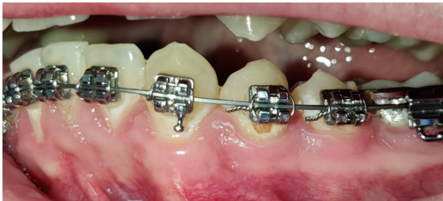
Slika 4. Prikaz inicijalne karijesne lezije tijekom ortodontske terapije.

Prevalencija inicijalnih karijesnih lezija kod pacijenata u tijeku ortodontske terapije iznosi od 2 do 97%. Promjene na caklini mogu se uočiti već nakon 4 tjedna od početka terapije kao što je prikazano na Slici 4. Ortodontski pacijenti imaju veću incidenciju početnih karijesnih lezija u usporedbi s pacijentima koji nisu u terapiji. 50% ortodontskih pacijenata razvije i više inicijalnih karijesnih lezija tijekom terapije, a samo 24% pacijenata ih uopće ne razvije (40).