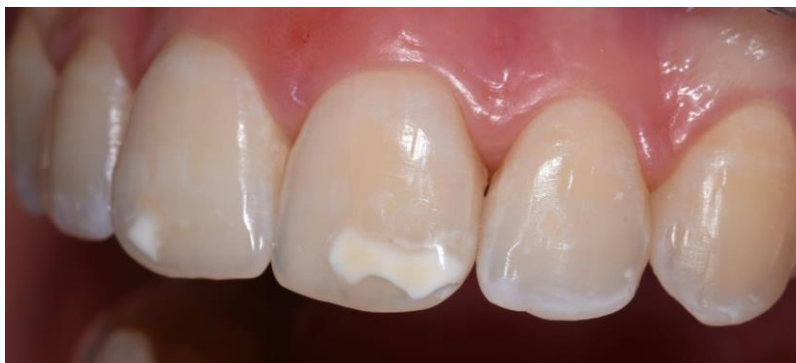
Slika 2. Prikaz MIH-a na trajnim, gornjim središnjim sjekutićima. Slika preuzeta uz dopuštenje autorice Jelene Bradić, dr. med. dent.

Mnoga istraživanja provedena su s ciljem pronalaska točnog uzročnika MIH-a, no etiologija je i dalje nepoznata. Čimbenici koji dovode do nastanka MIH-a su: neonatalni problemi (mala porođajna težina, nedonoščad, intubirana djeca), rane dječje bolesti (astma, bronhitis, otitis media), antibiotska terapija, hospitalizacije (31). Prevalencija MIH-a kod djece i adolescenata iznosi od 2,8 do 40% (32). Kliničku sliku MIH-a karakteriziraju opaciteti bijele, žute ili svijetlo smeđe boje različitih veličina (Slika 2). Promjene su asimetrične, mogu se javiti na svim prvim trajnim molarima dok su na incizivima promjene obično manjih dimenzija. Posteruptivni lomovi cakline mogu se javiti odmah nakon nicanja zuba ili kasnije tijekom života, a nastaju zbog djelovanja žvačnih sila na oslabljenu/hipomineraliziranu caklinu (33).