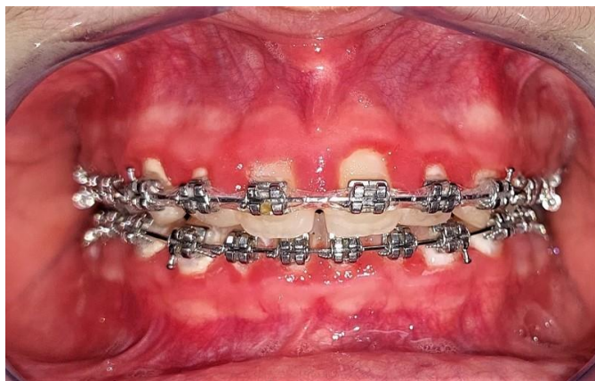
Slika 5. Elastomerne ligature, predilekcijska mjesta za nakupljanje plaka.

Riječ je o novijoj metodi detekcije karijesa koja se temelji na promjeni električne vodljivosti u karijesnim lezijama u odnosu na zdrava tkiva. Karijesom zahvaćena područja imaju poroznosti ispunjene vodom i ionima te mogu provoditi električnu energiju, stoga je vodljivost električne energije kroz karijesom zahvaćeni zub veća u odnosu na zdravi zub (47).