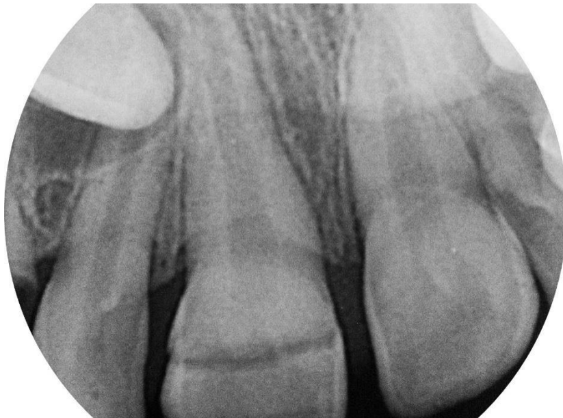
Slika 5. Prikaz ortopantomogramske snimke na mjestu frakturane linije komplikovane frakture gornjeg središnjeg desnog sjekutića.