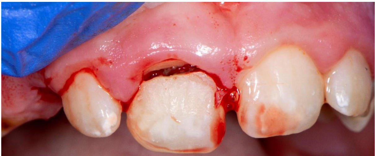
Slika 3. Komplicirana trauma gornjeg središnjeg desnog sjekutića uočena kliničkim pregledom.

Na Zavod za dječju i preventivnu dentalnu medicinu Stomatološkog fakulteta Sveučilišta u Zagrebu dolazi dvanaestogodišnja pacijentica u pratnji majke jer je prilikom sata plesa pala i doživjela dentalnu traumu. Anamneza je bila bez osobitosti. Kliničkim pregledom uočena je komplicirana fraktura krune gornjeg središnjeg desnog sjekutića (Slika 3.). Napravljena je ekstraoralna panoramska RTG snimka (ortopantomogram) koja potvrđuje postavljenu kliničku dijagnozu (Slika 4. i Slika 5.). Također, testovi vitaliteta ukazali su na vitalnost pulpe. Iz tog razloga, izbor terapije koja će u daljnjem postupku biti opisana je djelomična pulpotomija po Cveku.