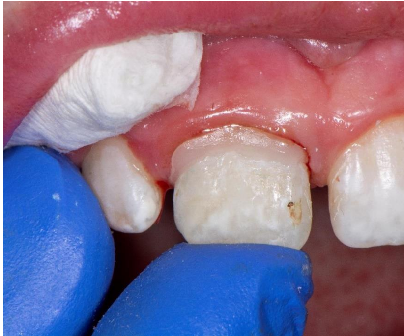
Slika 12. Izgled završne restauracije nakon lijepljenja odlomljenog fragmenta zuba.