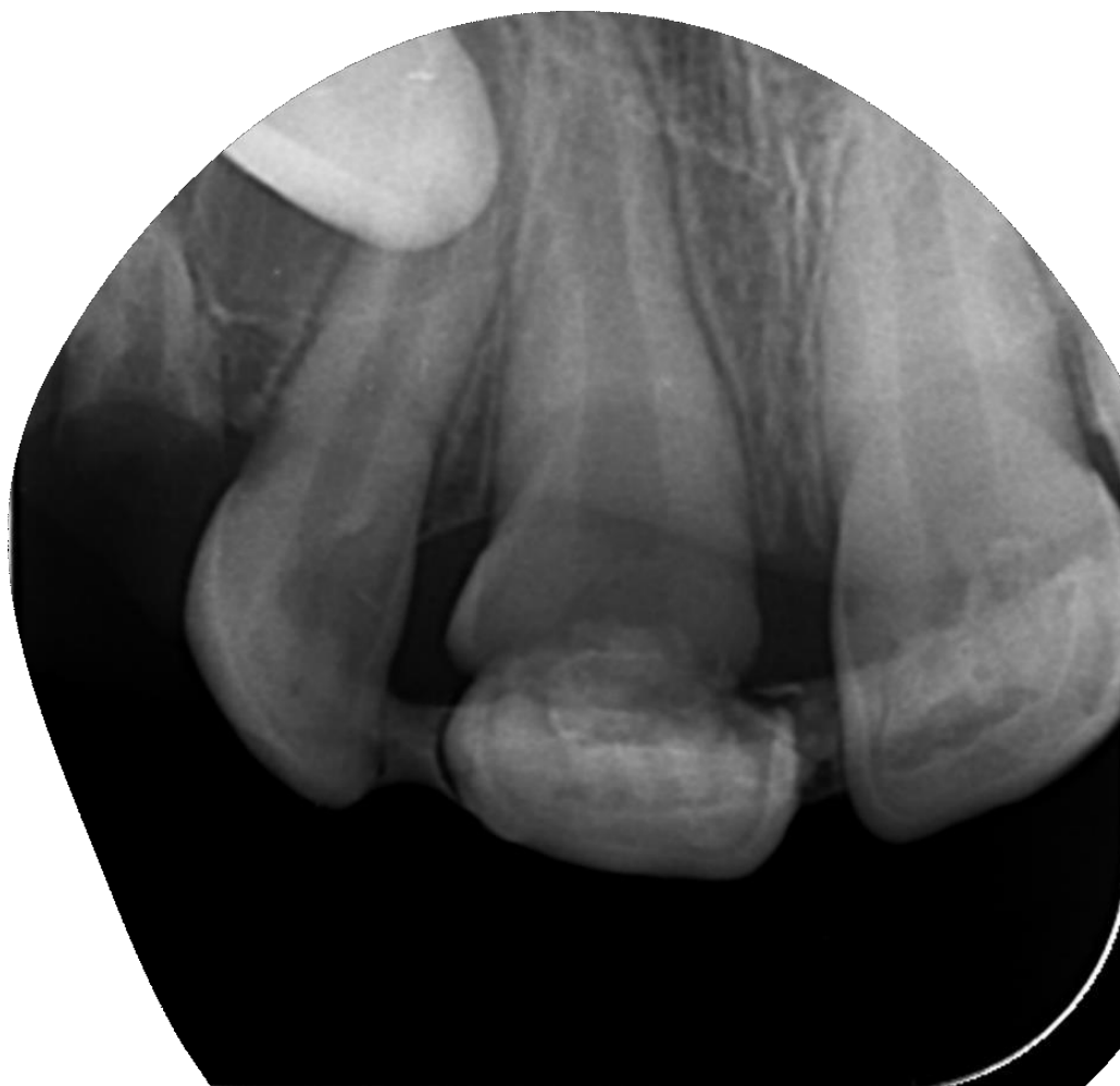
Slika 15. Kontrolna radiološka snimka nakon šest mjeseci.