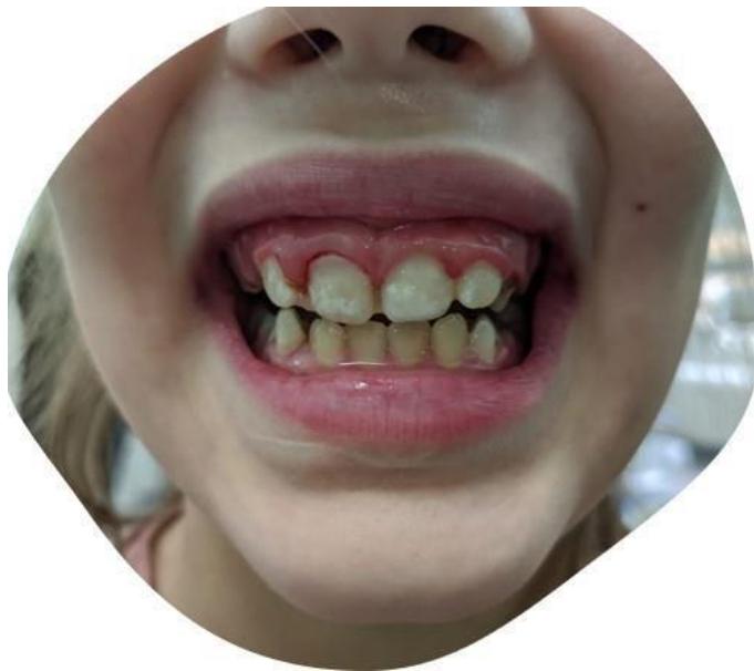
Slika 14. Klinički pregled šest mjeseci nakon traume.

Nakon šest mjeseci, pacijentica dolazi na kontrolni pregled. Učinjena je RTG snimka kojom nisu registrirane periapikalne promjene, klinički pregled te testovi vitaliteta koji su dali pozitivne rezultate (Slika 14. i Slika 15.). Uspješna terapija prikazana ovim kliničkim slučajem omogućuje mladoj pacijentici daljnji fizički, ali i psihološki razvoj te ne narušava njeno samopouzdanje u adolescenciji.