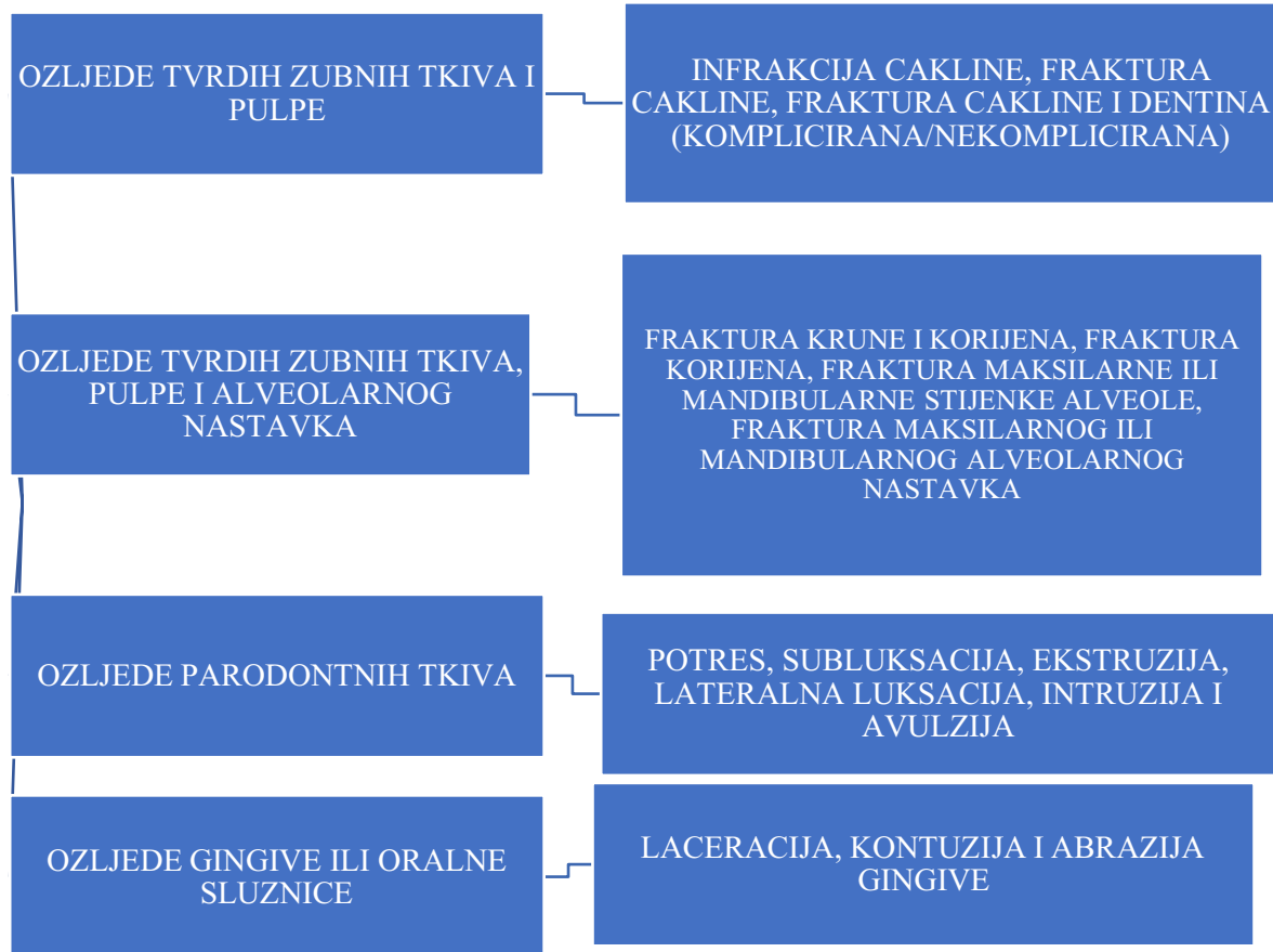
Slika 1. Andreasenova klasifikacija dentalnih trauma (1).