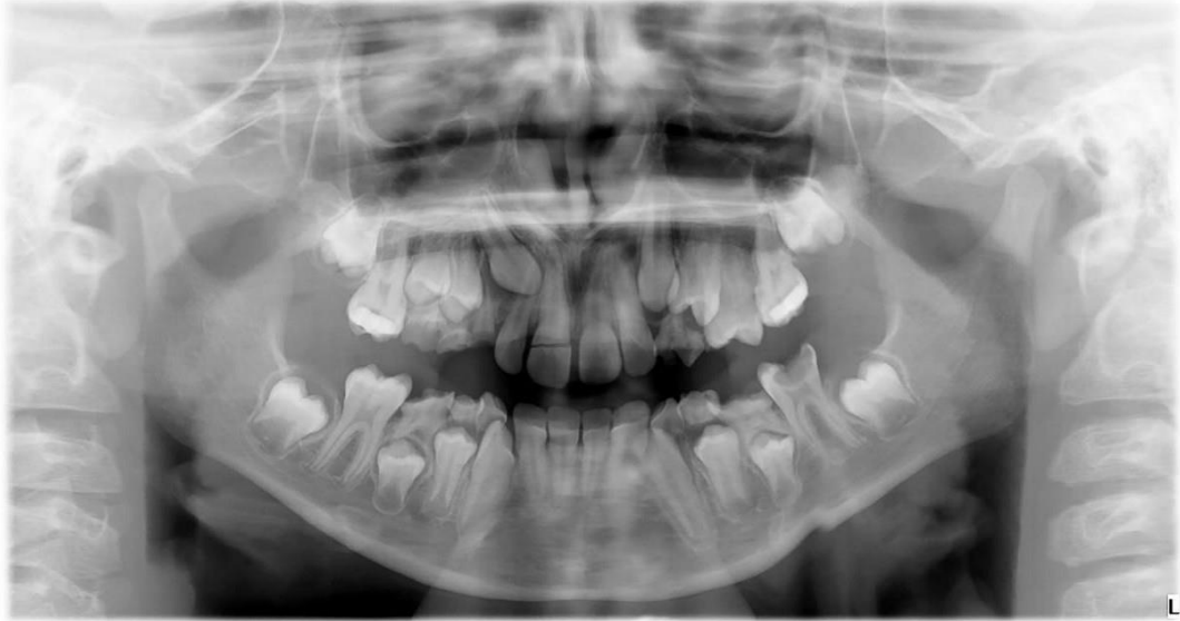
Slika 4. Ortopantomogram kojim je potvrđena klinička sumnja na komplikovanu frakturu krunice gornjeg središnjeg desnog sjekutića.