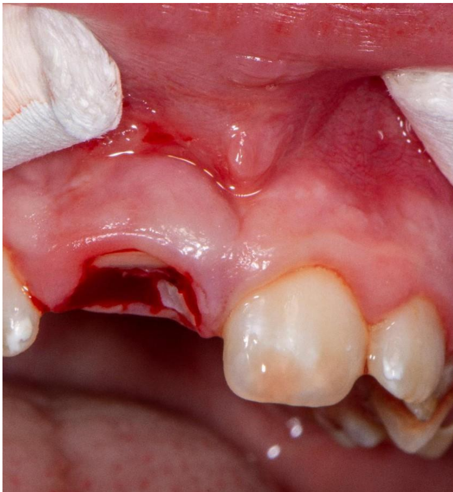
Slika 6. Stanje u usnoj šupljini nakon uklanjanja odlomljenog fragmenta krune.

Radi očuvanja suhog radnog polja tijekom terapijskog postupka i preglednosti područja zahvaćenog traumom, u gornji vestibulum unose se dva svitka staničevine (vaterolice) s obje strane frenuluma gornje usnice. Potom se uklonio odlomljeni fragment krune zuba (Slika 6.) te je postavljen u fiziološku otopinu do završne restauracije (Slika 7.). Nakon pet minuta, hemostaza je postignuta postavljanjem sterilne vaticice natopljene otopinom natrijeva hipoklorita (Slika 8.).