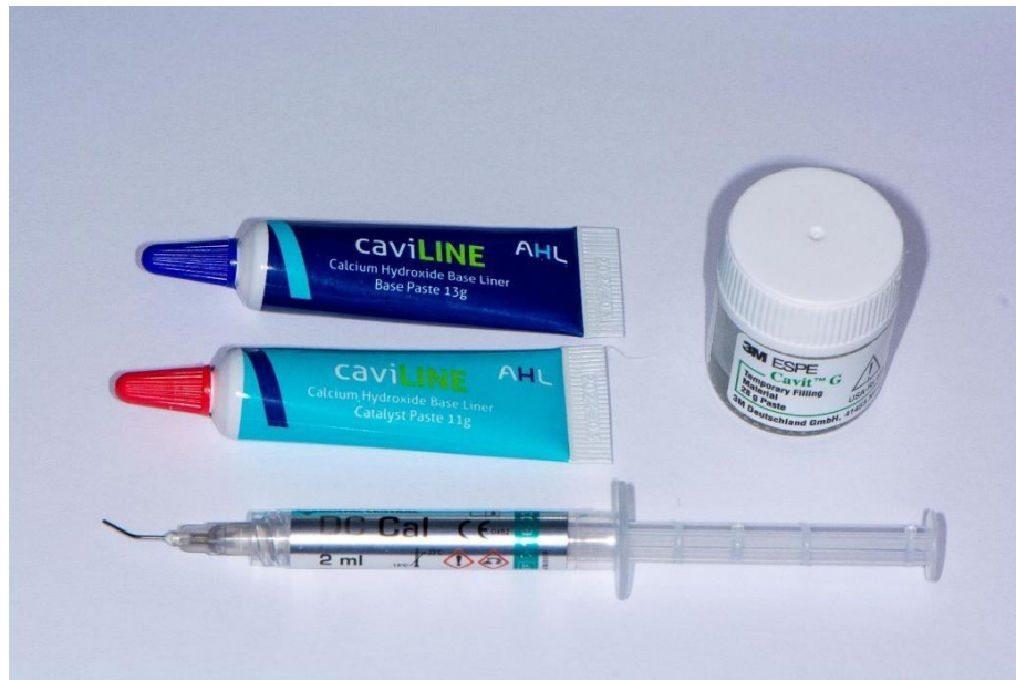
Slika 9. Materijali na bazi kalcijeva hidroksida korišteni za prekrivanje eksponirane pulpe. Preuzeto s dopuštenjem autora izv. prof. dr. sc. Dubravke Negovetić-Vranić.

Na eksponirano područje pulpe postavljena je pasta kalcijeva hidroksida DC Cal® (DC Dental Central, Hamburg, Njemačka), a na pastu liner također na bazi kalcijeva hidroksida caviLINE® (AHL, Tonbridge, Ujedinjeno Kraljevstvo) (Slika 9.). Potom je postavljena staklenoionomerna podloga (Slika 10.).