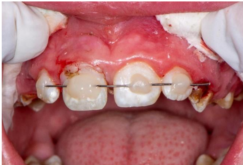
Slika 13. Postavljeni žičano-kompozitni splint.