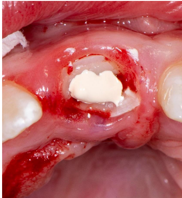
Slika 10. Postavljena staklenoionomerna podloga.