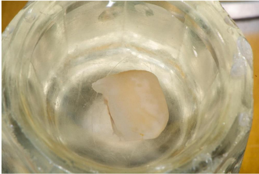
Slika 7. Odlomljeni fragment krune gornjeg središnjeg desnog sjekutića postavljen u fiziološku otopinu.