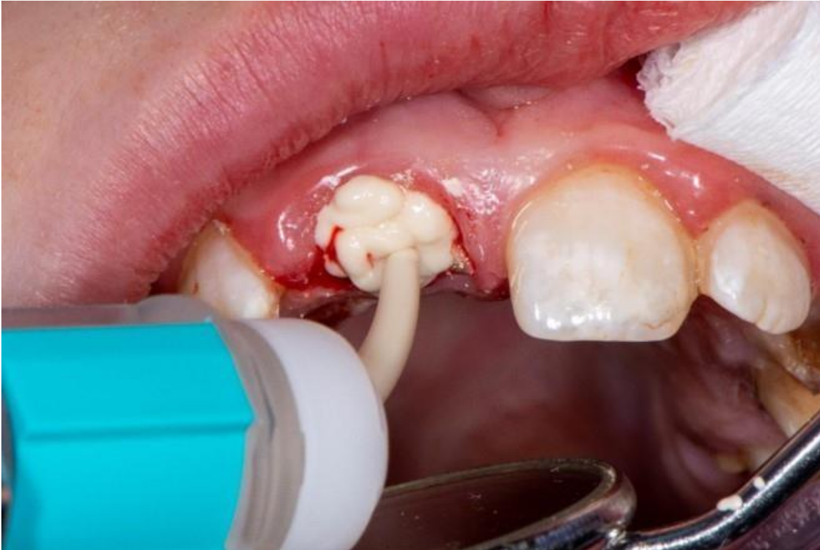
Slika 11. Izrada konačne restauracije staklenoionomernim ispunom.

Odlomljeni fragment zalijepio se staklenoionomernim materijalom te se završno restauriralo kompozitom (Slika 11. i Slika 12.). Postavljen je fleksibilni žičano-kompozitni splint debljine 0,4 mm, koji osigurava fiksaciju fragmenta, ali i omogućava zubu minimalne fiziološke kretnje kako bi se rizik od ankiloze sveo na minimum (Slika 13.). Nakon dva tjedna uklanja se postavljeni žičano-kompozitni splint.