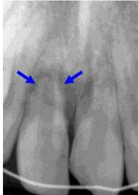
Slika 3. Upalna resorpcija

zaštitnog cementnog pokrova. Prvi radiološki znakovi upalne resorpcije se opažaju 2 tjedna nakon replantacije i najuočljiviji su u cervikalnoj trećini korijena.