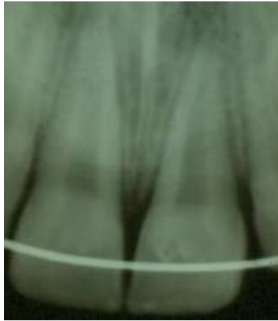
Slika8. Rendgenogram nakon replantacije pokazuje ispravnu repoziciju izbijenog zuba i žicu splinta.