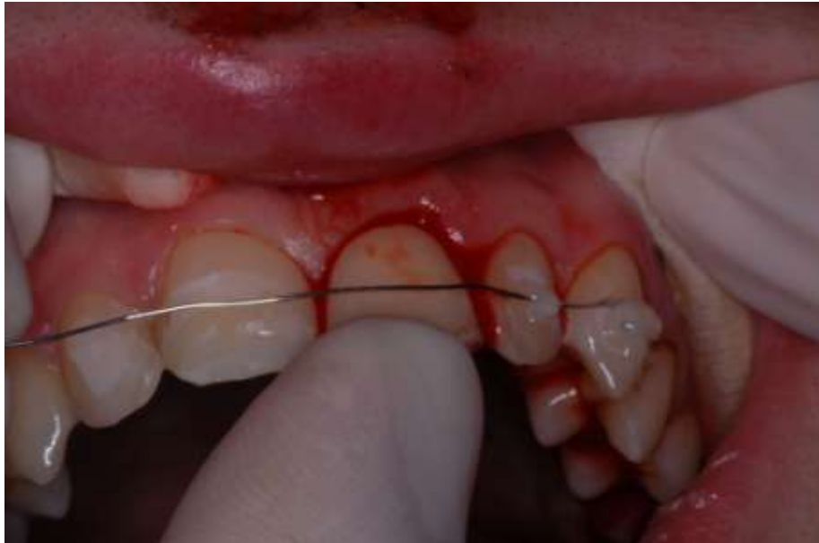
Slika 6. Žičano-kompozitni splint fiksiran na susjedne zube i repozicija izbijenog zuba.