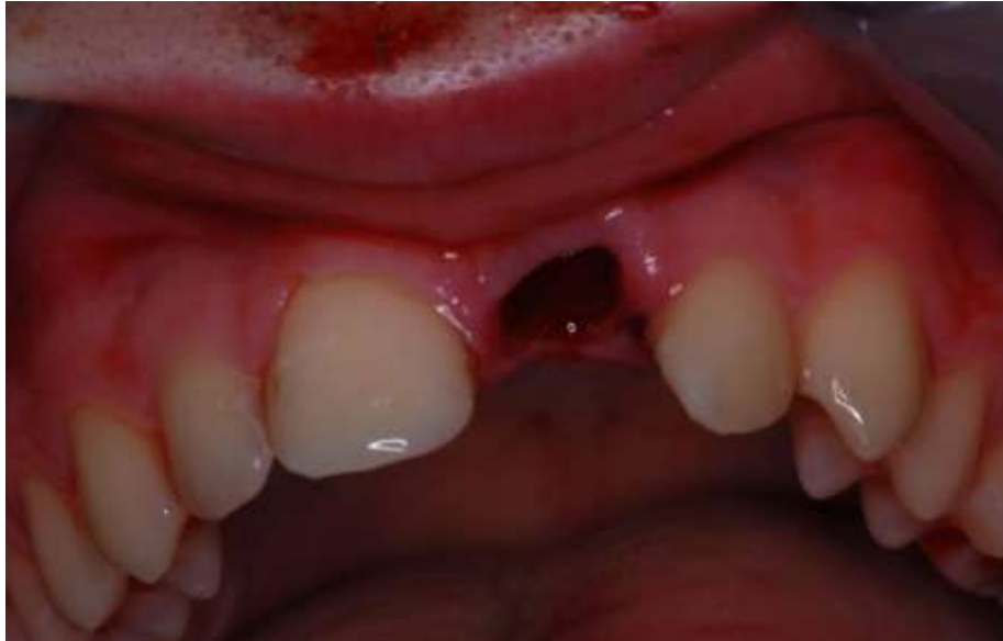
Slika 5. Priprema alveole prije replantacije 21; ispiranje fiziološkom otopinom