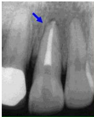
Slika 1. Površinska resorpcija korijena ( preuzeto s www.dentaltraumaguide.com )

Histološki je karakteriziran ograničenim površnim resorptivnim lakunama na površini korijena koje su reparirane cementom. Ovo stanje predstavlja ograničena oštećenja periodontalnog ligamenta ili cementa koja su samoograničavajuća i koja se repariraju novim cementom. Zbog male veličine površna resorpcija se ne vidi na rendgenskoj snimci.