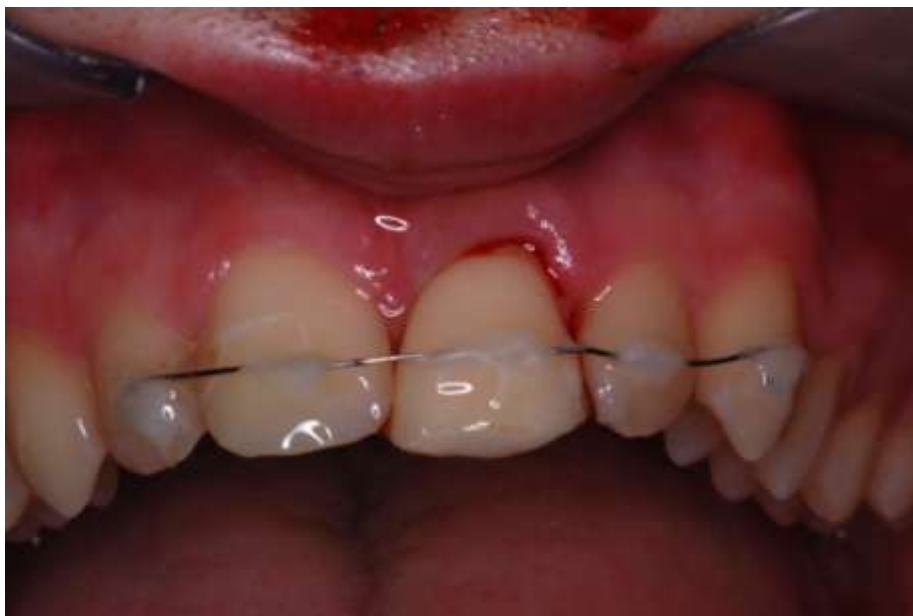
Slika 7. Replantiran i imobiliziran izbijeni zub (21)