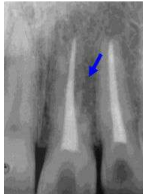
Slika 2. Ankilozna resorpcija

isušenja zuba prije replantacije. Radiološki je ankiloza karakterizirana nestankom periodontalnog prostora. Nadomjestna resorpcija se obično uočava 2 mjeseca nakon replantacije zuba. Klinički je zub nepomičan i kod djece u infrapoziciji. Perkusijski ton je visok.