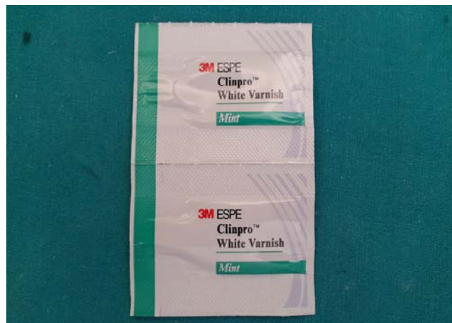
Slika 13. Fluoridni lak Clinpro White Varnish.