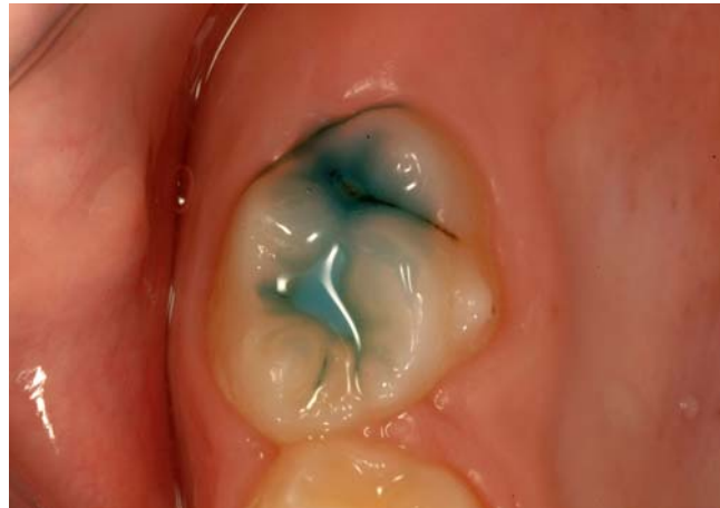
Slika 6. Jetkanje.

i tehnika mikroabrazije zrakom koja čisti organski sadržaj jamica i fisura prije samog pečačenja (14). Preventivnom restauracijom se odstranjuje meko karijesno tkivo u dijelovima fisura, s minimalnim gubitkom čvrstog tkiva, a to uključuje prevenciju i zaustavljanje karijesa u ostatku fisura, aplikacijom restaurativnog materijala i pečatnog materijala koji prekriva sve dijelove fisura (4). Sredstvo za pečačenje stavlja se preko polimeriziranog materijala i preko preostalih fisura, kao zaštita od nastanka karijesa te štiti kompozitni ispun od abrazije (13).