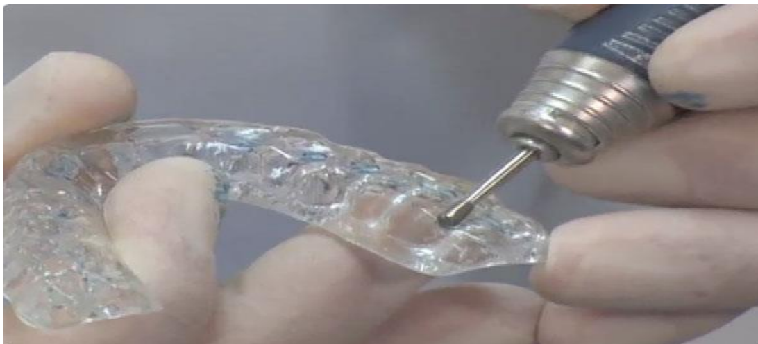
Slika 4. Prilagodba udlage ubrušavanjem .

Pregledano je osam pacijenata i uzeta im je anamneza. Pacijentima je napravljena relaksacijska udlaga u centriku. Prvi pregled je bio nakon 7 - 10 dana. Na prvom pregledu, nakon dobivanja udlage, s artikulacijskim papirom su se provjerili mogući neželjeni kontakti koji su se, ako su postojali, ubrusili u samu udlagu te je uzeta anamneza (slika 4). Zatim je, ponovo, nakon mjesec dana uzeta anamneza od pacijenta o ublažavanju simptoma koje navode u prvoj posjeti prije dobivanja udlage. Nakon toga upućeni su da i dalje nose udlagu što je moguće više, ali svakako po noći. Radi njihove primarne bolesti pacijentima je bilo otežano dolaziti na Stomatološki fakultet u Zagrebu radi kontrole udlage, ali su svi pacijenti bili telefonski kontaktirani kako bi naveli je li došlo do kakvog poboljšanja i nose li udlagu.