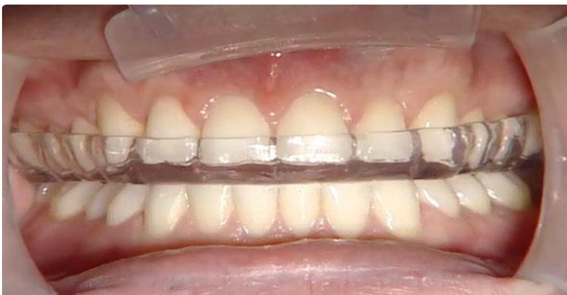
Slika 3. Relaksacijska udlaga u ustima pacijenta.

kontakte na premolarima i molarima te da su frontalni zubi izbačeni iz kontakta, osim prilikom lateralnih i protruzijskih kretnji. Prilikom lateralnih ili protruzijskih kretnji imamo disokluziju u području molara (4). Koriste se kod abradiranih zuba kako ne bi došlo do pogoršanja (bruksizam), a za poboljšanje kretnji donje čeljusti u vertikali te za relaksaciju mišićnog tonusa (slika 3).