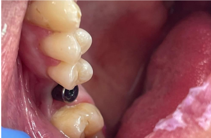
SLIKA 4. Ugrađeni implantata s gingiva formerom na mjestu gornjeg desnog prvom molara.