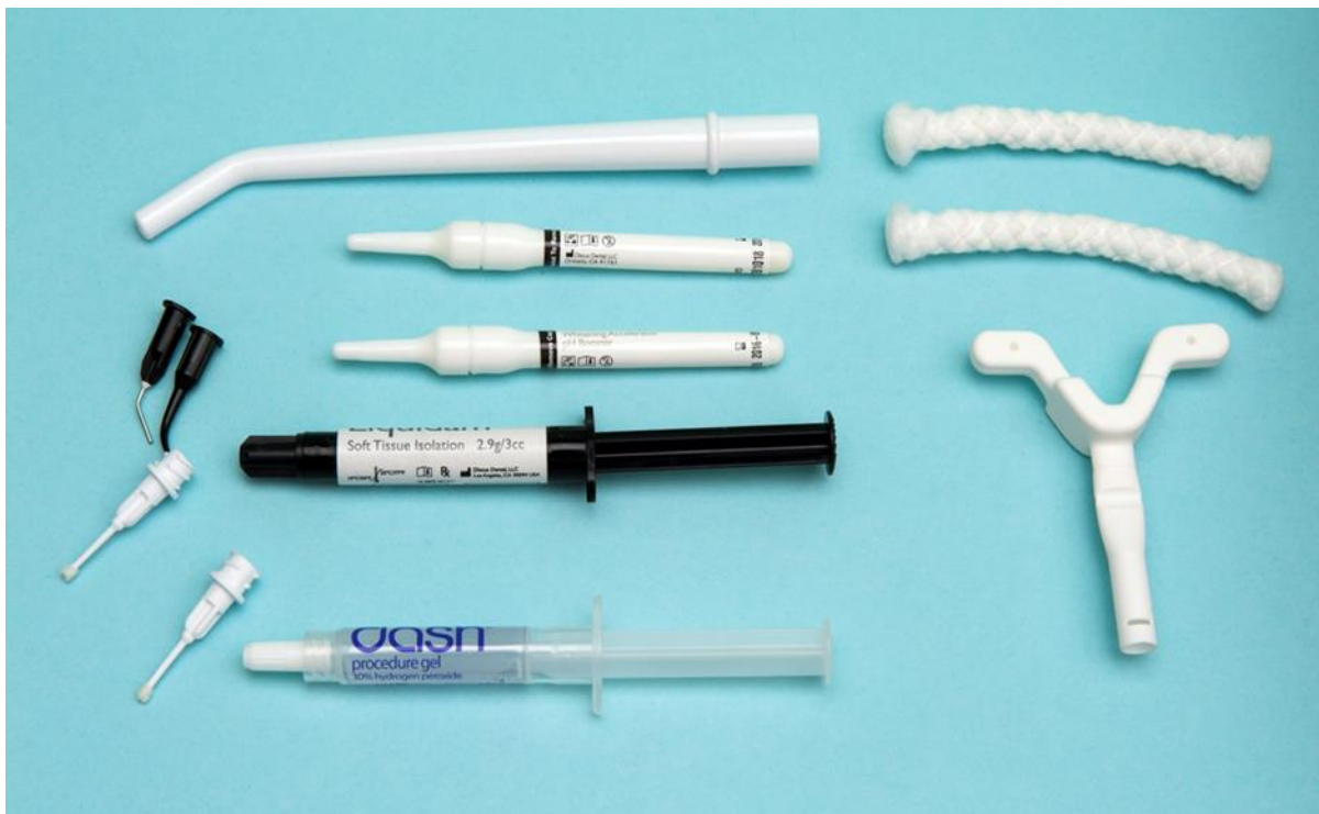
Slika 6. Sastavni dijelovi Dash sustava.