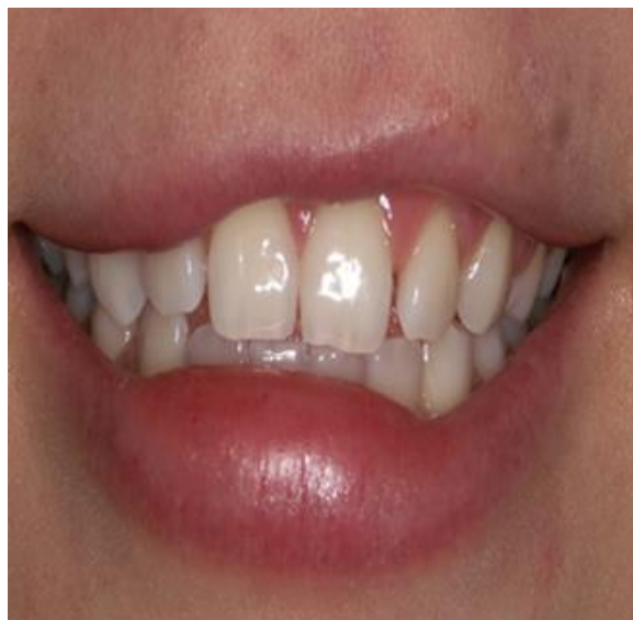
Slika 10. Otekline usnice zbog kontakta sa sredstvom za izbjeljivanje i zagrijavanja lampe za izbjeljivanje