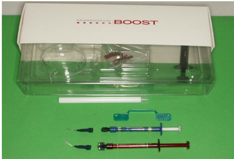
Slika 1. Opalescence Boost set za izbjeljivanje zubi (Ultradent, SAD).