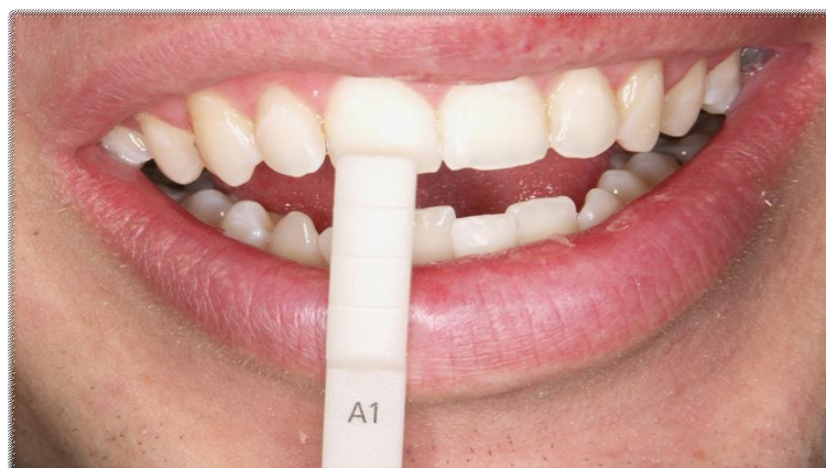
Slika 4. Završna boja nakon izbjeljivanja