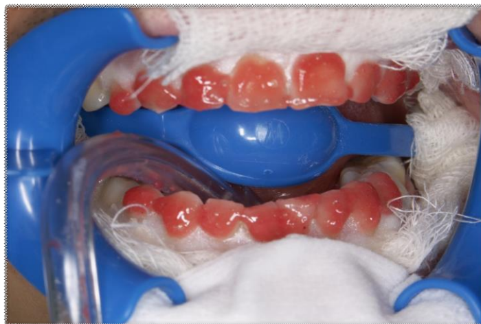
Slika 3. Postavljena gingivna zaštita i gel za izbjeljivanje