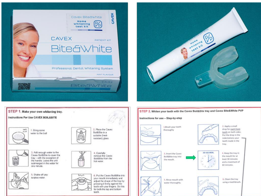
Slika 8. Cavex Bite and White (Cavex, Nizozemska) sustav za izbjeljivanje kod kuće

Najčešće se koristi 10%-tni karbamid peroksid, no može se koristiti i 10%-tni vodikov peroksid. Tretman se može ubrzati ako se poveća koncentracija karbamidnoga peroksida (25, 26).