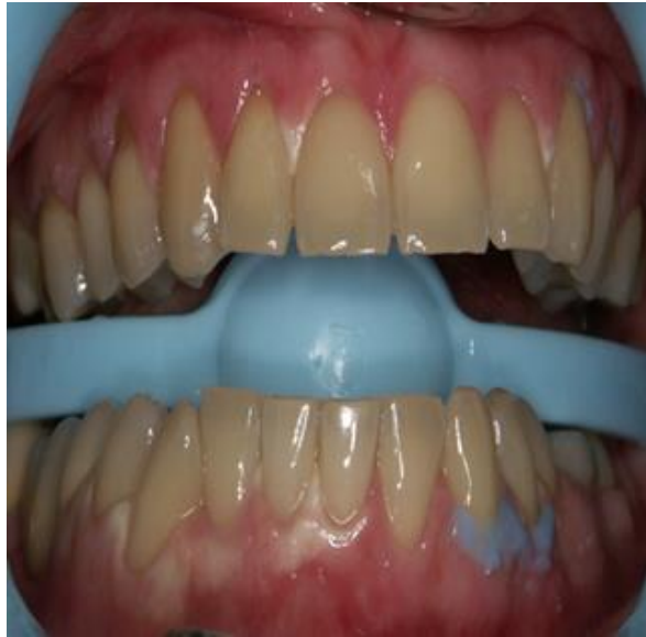
Slika 9. Otekline sluznice zbog kontakta sa sredstvom za izbjeljivanje

Neka istraživanja pokazuju da postupci koji prethode procesu izbjeljivanja mogu uzrokovati preosjetljivost. Pojavljuje se dentinska preosjetljivost (37).