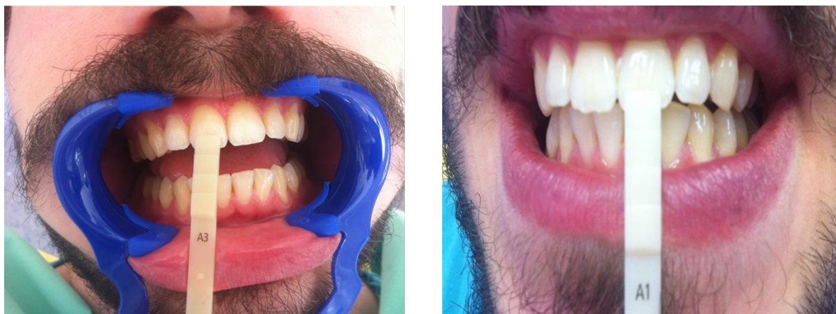
Slika 7. Početna i završna boja zuba nakon izbjeljivanja Dash metodom