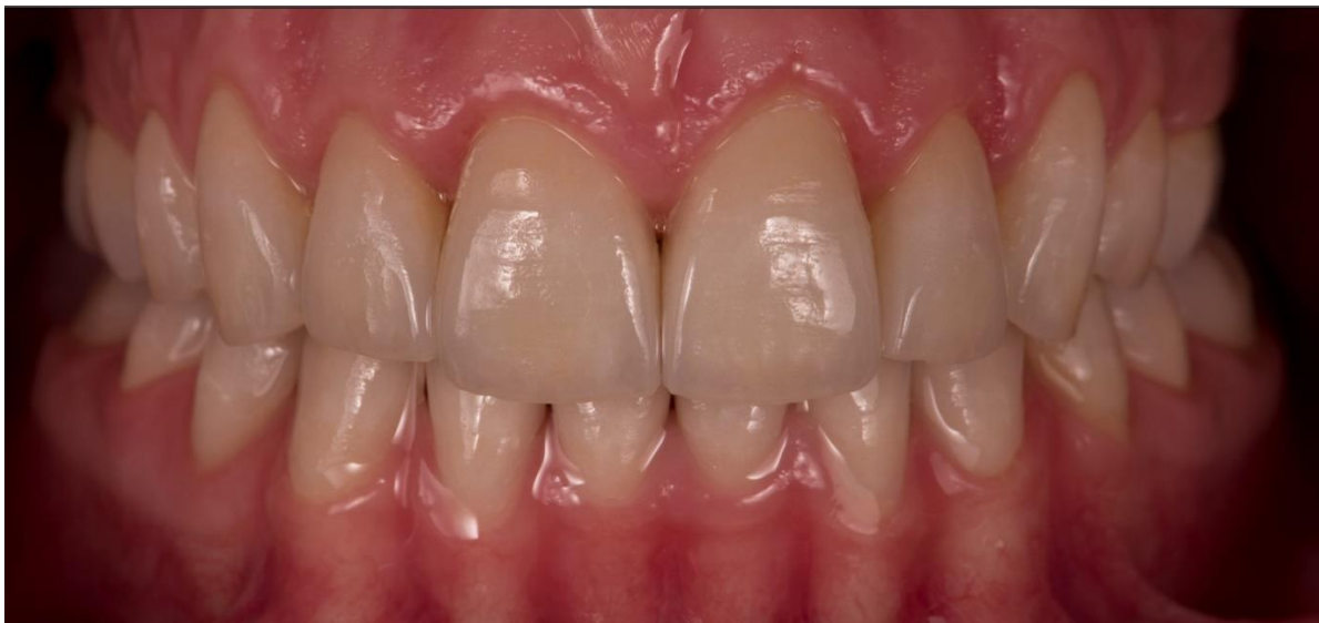
Slika 8. Cementirane potpuno keramičke krunice.