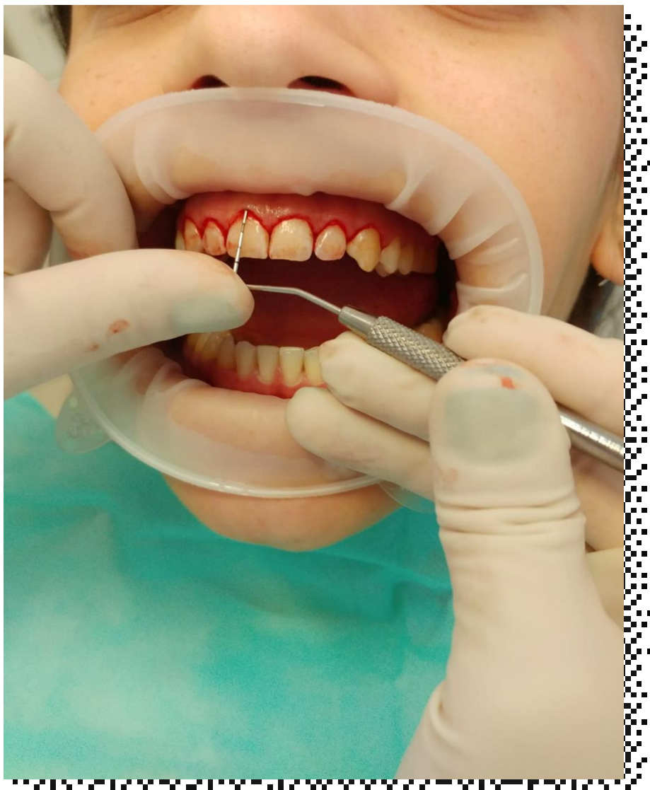
Slika 6. Provjera preparacije reznja

Pacijentica je naručena na kontrolu za tjedan dana i za dva tjedna poslije operativnog zahvata (Slika 7.).