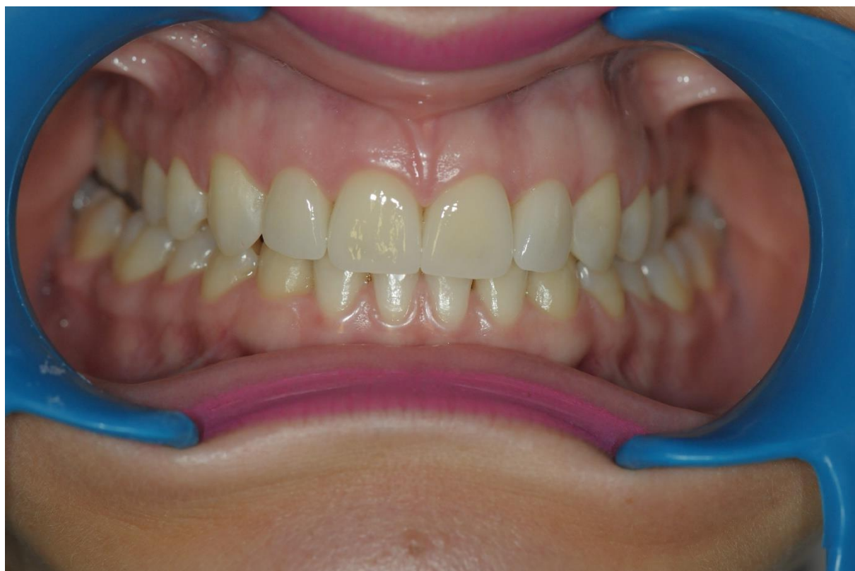
Slika 10. Intraoralna slika poslije cementiranja

Kada je završeno cementiranje ljuskica, kompozitom su preoblikovani lijevi i desni incizalni dio očnjaka (Slika 10,11.).