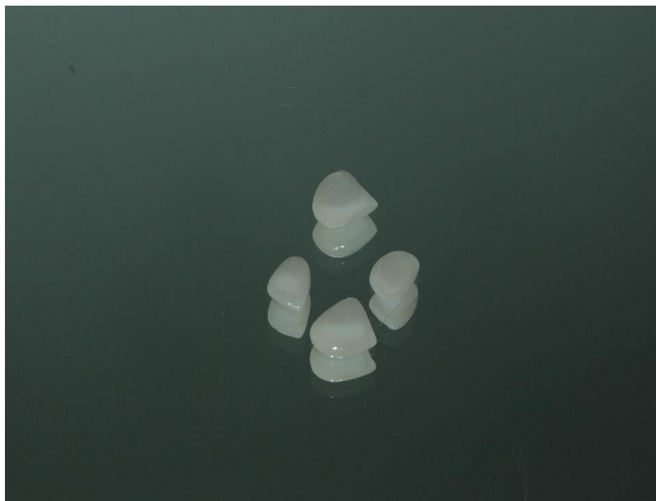
Slika 9. Ljuskice od glinične keramike

Materijal kojim se radi protetski nadomjestak je glinična keramika (Slika 9.). Glinična keramika najvjernije oponaša intaktan zub, a upravo to da postignemo što prirodniji izgled novih zubi bio nam je i cilj.