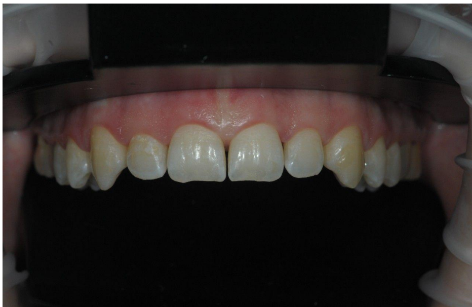
Slika 7. Pacijentica 14 dana poslije zahvata.

Četiri tjedna nakon operativnog zahvata učinjena je korekcija. Zubi su minimalno prebrušeni, napravljena je gingivektomija i izrada direktnog provizorija u ustima prema wax-upu kako bih se spriječilo ponovno spuštanje gingive (Slika 8.).