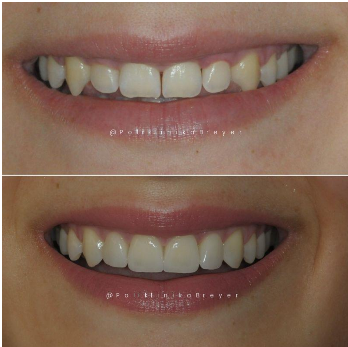
Slika 11. Intraoralna slika početne situacije i završenog rada