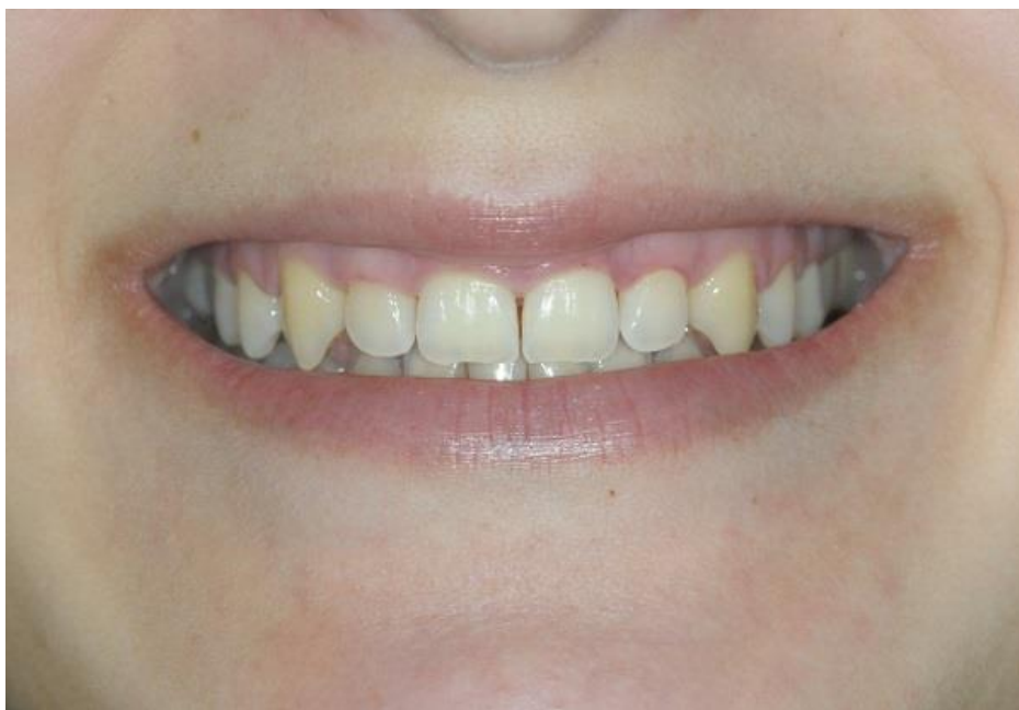
Slika 1. Početna situacija u osmijehu.