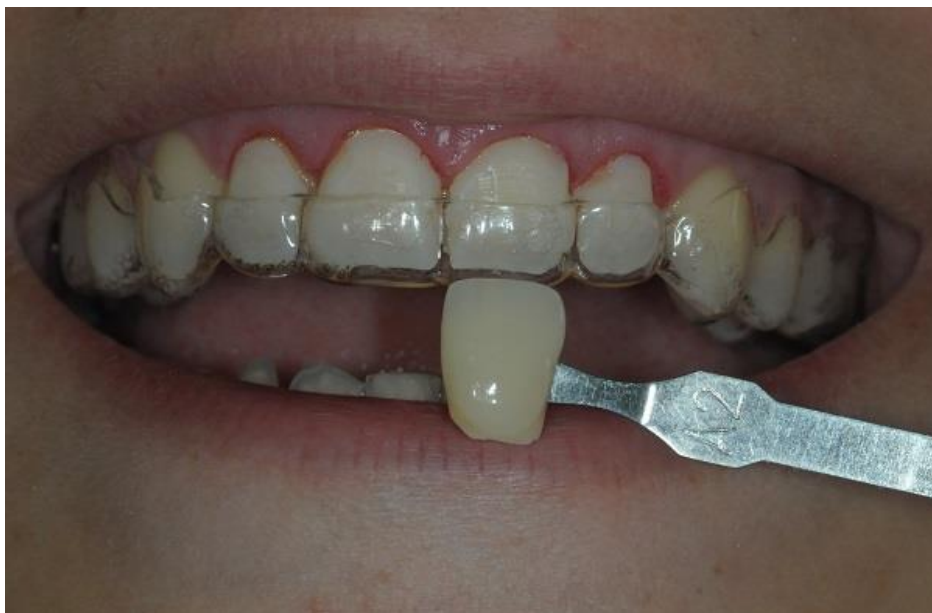
Slika 8. Pacijentica s wax-upm

Četiri tjedna nakon operativnog zahvata učinjena je korekcija. Zubi su minimalno prebrušeni, napravljena je gingivektomija i izrada direktnog provizorija u ustima prema wax-upu kako bih se spriječilo ponovno spuštanje gingive (Slika 8.).