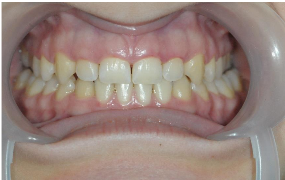
Slika 3. Intraoralna snimka početna situacije.