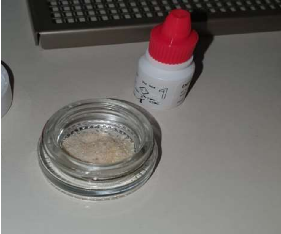
Slika 5. Otopina za ispiranje dentinskog praha.