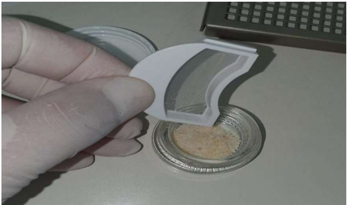
Slika 4. Dobiveni dentinski prah nakon drobljenja.