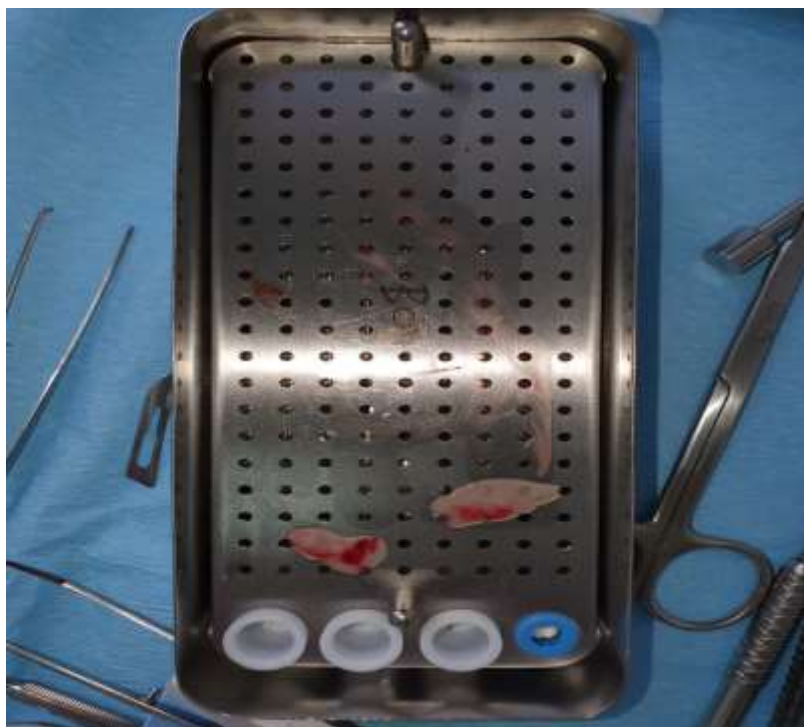
Slika 8. PRF membrane.