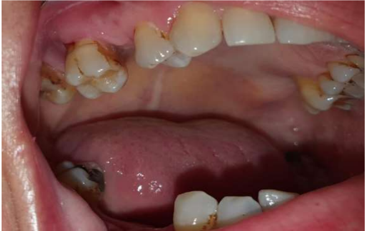
Slika 1. Zub koji je namijenjen za ekstrakciju.