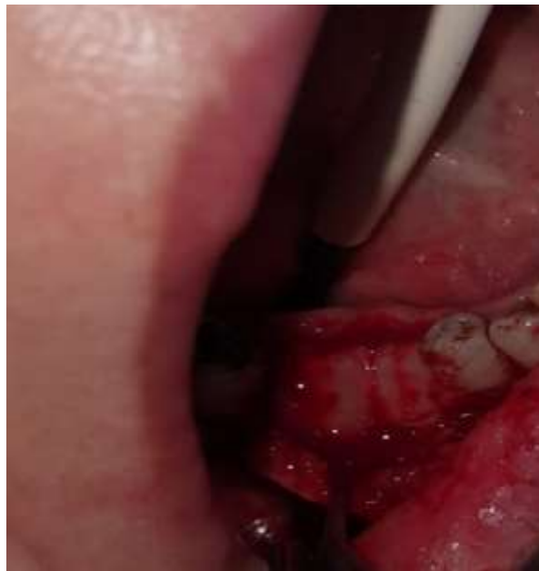
Slika 10. Dentinski graft prekriven PRF membranom.