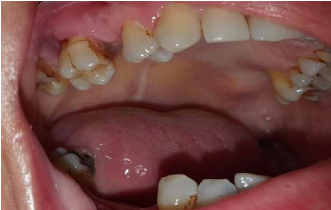
Slika 1. Zub koji je namijenjen za ekstrakciju.