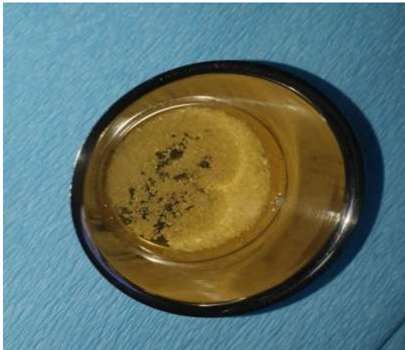
Slika 6. Dentinski prah potopljen u otopinu.