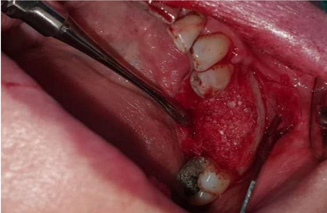
Slika 9. Augmentirano mjesto dentinskim prahom.