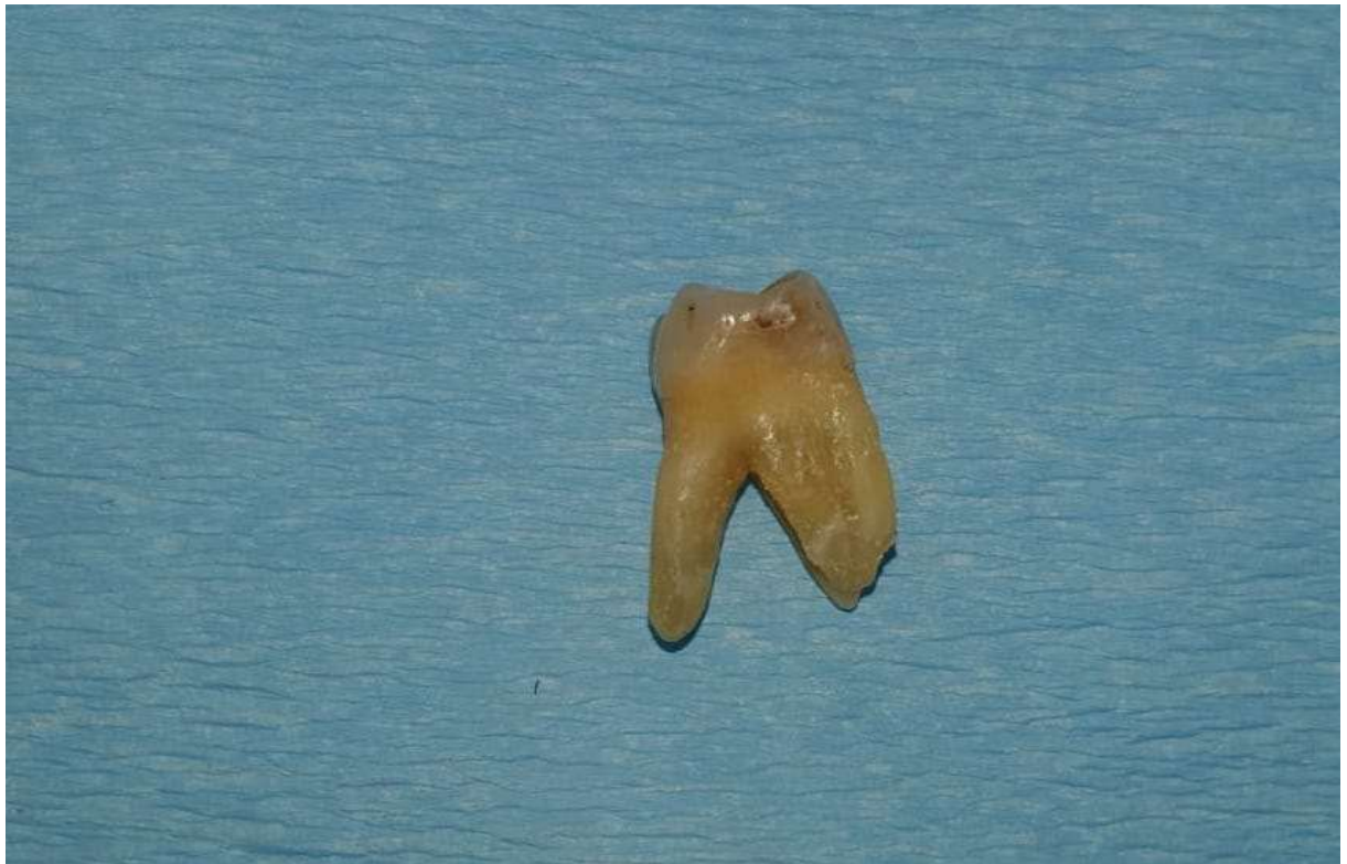
Slika 3. Ekstrahirani zub.