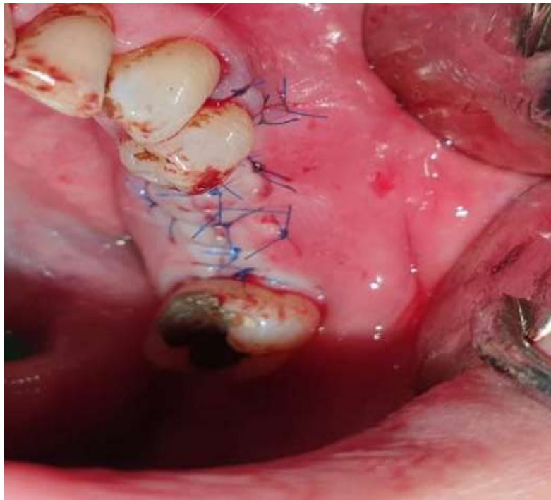
Slika 11. Operacijsko mjesto zatvorenom šavovima.