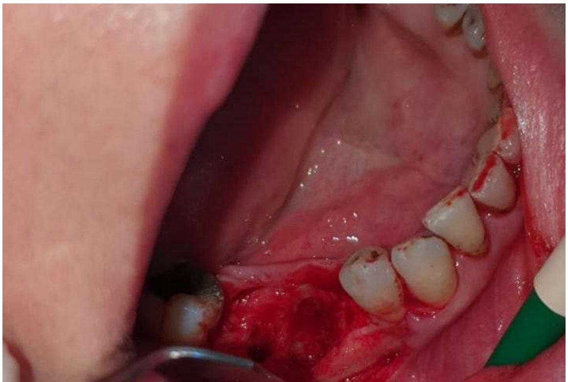
Slika 2. Prikaz alveolarnog grebena nakon podizanja režnja. Preuzeto s dopuštenjem autora: Luka Marković, univ. mag. med. dent., specijalist parodontologije