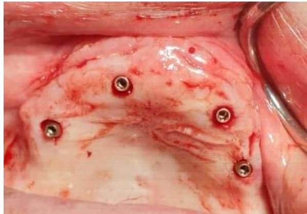
Slika 2. Prikaz ugradnje implantata flapless tehnikom.

Prednosti ove metode su kraće trajanje kirurškog postupka, minimalno krvarenje, manje postoperativne nelagode za pacijenta, mogućnosti trenutnog opterećenja ugrađenog implantata te manje vremena potrebnog za kompletnu implantoprotetsku restauraciju. Zbog smanjene preglednosti, postoji opasnost od fenestracije kortikalne kosti i oštećenja anatomskih struktura. Zbog navedenog danas se rijetko koristi (34, 36).