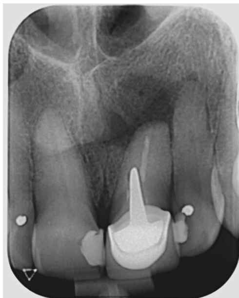
Slika 14. Kontrolna rendgenska snimka nakon 5 mjeseci