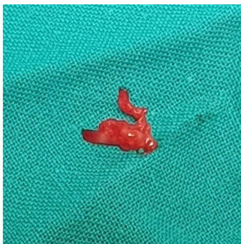
Slika 7. Uzorak tvorbe za patohistološku analizu