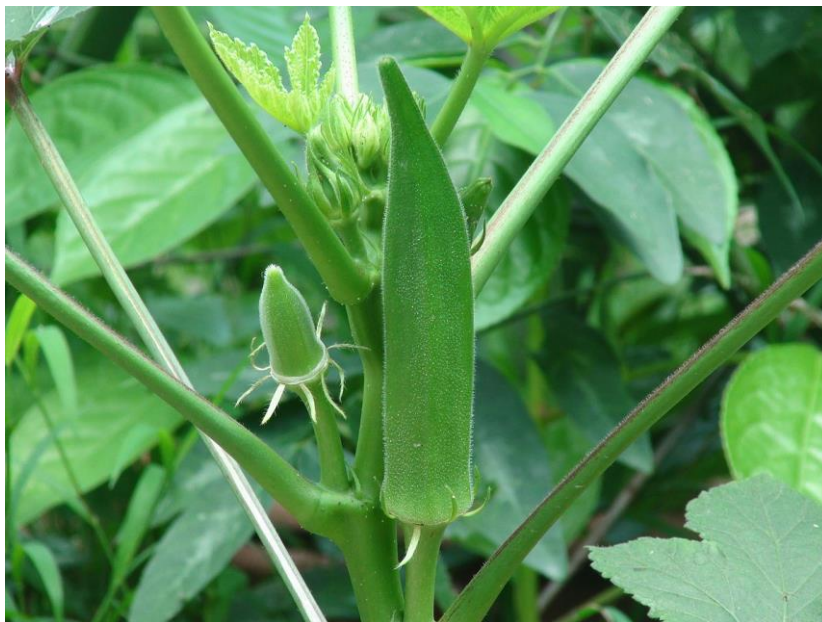
Slika 4. Bamija

Najkraće vrijeme vlaženja sluzi bamije osigurava njezinu prednost među svim ostalim biljkama korištenim u izradi preparata za nadomjestak sline. Dodatnu prednost joj daje i sposobnost upijanja vode te ulja otkrivena proučavanjem izolirane sluzi (30, 31).