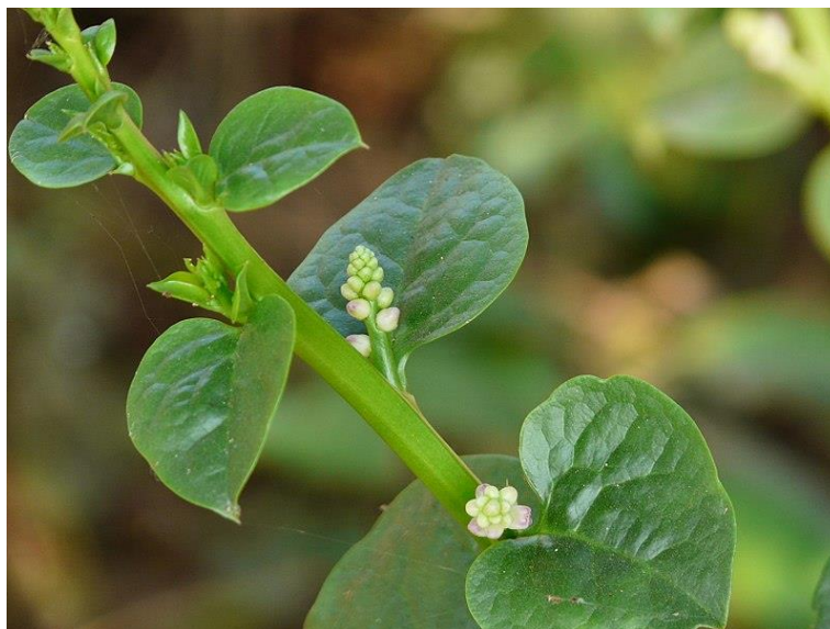
Slika 5. Indijski špinat

Indijski špinat jestiva je višegodišnja biljka koja raste u tropskoj Aziji i Africi gdje se već dugi niz godina koristi kao sredstvo za zgušnjavanje pri pripremi različitih jela, ali i u ljekovite svrhe kao blagi laksativ, diuretik i antipiretik te za tretiranje modrica i ogrebotina. Bogata je vitaminima A i C, željezom, kalcijem te topljivim vlaknima. Iz njenog cvijeta izolirana je sluz sastavljena pretežno od polisaharida u kojima je D-galaktoza glavni monosaharid.