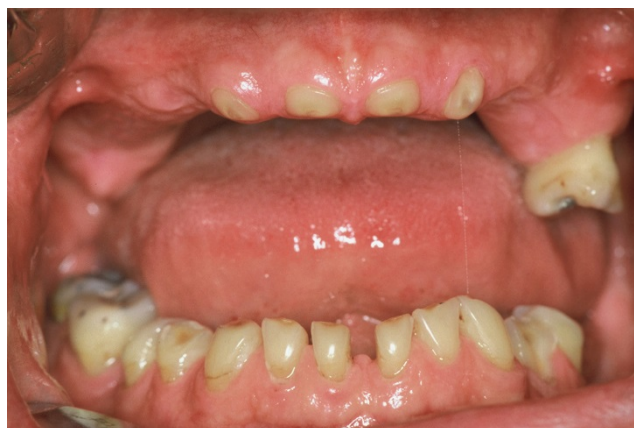
Slika 2. Nekontrolirani bruksizam kao uzrok potpunog gubitka zubnih kruna (preuzeto iz 2)

Bruksizam je poremećaj koji seže daleko u ljudsku povijest. Taj problem prati čovjeka praktički od njegova nastanka, od barbarskih vremena, preko Biblije i kršćanstva do današnjeg modernog, stresom opterećenog čovjeka (7). Škripanje zubima se od davnina smatralo kao znak bijesa, ljutnje i frustracije. Riječ bruksizam potiče od grčke riječi “ brukein “ što znači škrgutanje zubima. Iako je Black još u 19. stoljeću opisao abnormalno trošenje zubne cakline povezano s nefunkcionalnom aktivnošću (7), termin bruksizam u znanstvenoj literaturi prvi put koristi Marie Pietkiewicz 1907. ( La bruxomanie ) (3). Stav o uzroku i liječenju se mijenjao tijekom godina. U '60. godinama prošloga stoljeća, Ramfjord je kao uzrok prvenstveno smatrao okluzijsku interferencu (8). Današnja istraživanja kao i klinička iskustva ne ukazuju na veliku važnost malokluzija u etiologiji bruksizma, iako su i danas mnogi skloni vjerovanju u tu teoriju. Danas je opće prihvaćen biopsihosocijalni model bruksizma (Slika 2).