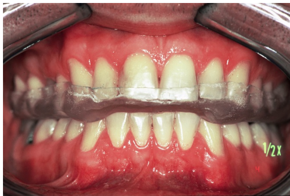
Slika 9. Okluzijska udlaga na gornjem zubnom nizu (preuzeto iz 2)

U terapiji se koriste sljedeći oblici udlaga: interdentalni štitnici, repozicijske i stabilizacijske udlage. Štitnici služe relaksiranju mišića koji su bolni zbog bruksizma (stiskanja, škripanja zubima i loših navika). Ova udlaga je sastavni dio terapije kojoj je cilj relaksirati sastavne dijelove stomatognatnog sustava. Repozicionirajuće udlage koriste se tijekom početne terapije udlagama, kada je narušen funkcijski odnos kondil–disk unutar čeljusnog zgloba (2). Udlagom se nastoji ponovno uspostaviti funkcijsko jedinstvo kondilarnog nastavka mandibule i zglobne pločice u slučajevima dislokacije diska. Stabilizacijske (michiganska) udlage imaju važnu ulogu u nastavku terapije udlagama (Slika 9). Cilj ove udlage je uspostaviti pravilno prednje vođenje, vođenje očnjakom, kao osnovu uspješne rehabilitacije (15).