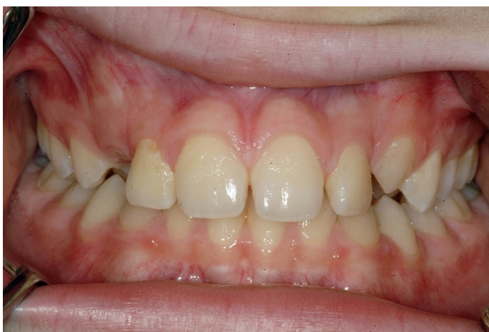
Slika 3. Okluzija s još neprimjetnom atricijom, a klinički potvrđenim bruksizmom u desetogodišnjeg dječaka (preuzeto iz 2)

Postoje različite studije o pogođenosti opće populacije bruksizmom. Međunarodna klasifikacija poremećaja spavanja tvrdi da čak 85-90% ljudi škripi zubima u nekom periodu tijekom života, ali samo 5% njih razvije kliničke simptome (8). Neke studije izjavljuju da je prevalencija noćnog bruksizma izjednačena između oba spola, dok kod tzv. “budnog bruksizma“ te brojke idu u prilog ženama (9). Iznenadujuće je da se javlja čak i u djece, i to 14–20% (Slika 3). Štoviše, može se pojaviti već nicanjem prvog zuba (10). Bruksizam se najčešće razvija u adolescentnoj dobi, između 18–29 godina, a izgleda da sa starenjem opada njegova učestalost (10). Zbog mimoilaženja u definicijama, razlika u metodama istraživanja, istraženih uzoraka populacije i subjektivnosti kliničkih nalaza, brojke o prevalenciji jako variraju. Rezultati zadnjeg istraživanja 2013. godine ukazuju na 8–31,4%, od čega 22,1–31% otpada na “budni bruksizam“, a 9,7–15,9% na noćni (9, 10).