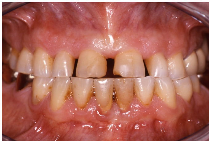
Slika 6. Posljedice ekscentričnog bruksizma–škripanja zubima (preuzeto iz 2)

degeneracije kolagenskih vlakana, a poslije i do sklerozacije krvnih žila. Dolazi do postupne obliteracije pulpne komorice, vertikalne resorpcije alveolarnoga grebena interdentalnog septuma s proširenjem periodontalne pukotine i demineralizacijom kosti, što se očituje na RTG snimci. Također dolazi do gubitka vertikalne dimenzije te smanjenja donje trećine lica (25, 26).