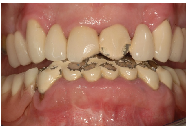
Slika 5. Aktricija psihijatrijske pacijentice na antidepresivnoj terapiji inhibitorom ponovne pohrane serotoninom (preuzeto iz 24)

Iako za sada nisu identificirani geni, koji bi mogli biti direktno odgovorni za bruksizam, promatranja su pokazala da 21–50% bruksista ima u obitelji nekog s manje ili više izraženom kliničkom slikom bruksizma (9). Važno je napomenuti provocirajući učinak alkohola, duhana, malnutriciju, poremećaje sna (13). Veća učestalost bruksizma je uočena kod ovisnika o drogama kao kokain i amfetamini (22), te kod pretjeranog konzumiranja proizvoda s kofeinom (23). Može biti povezan s Huntingtonovom bolešću, Parkinsonom, atipičnom facijalnom boli (13). Lijekovi također mogu uzrokovati bruksizam (16), a među njima su agonisti dopamina, triciklički antidepresivi, levadopa itd. (24) (Slika 5).