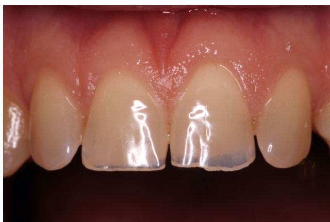
Slika 7. Posljedice centričnog bruksizma–stiskanja zubi (preuzeto iz 2)