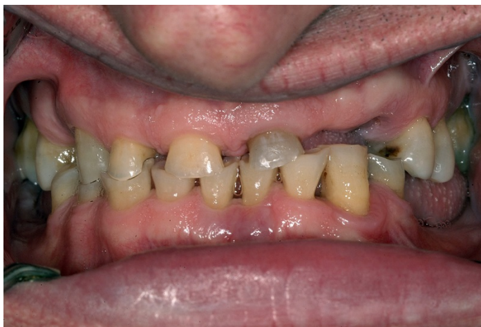
Slika 1. Izražena atricija zubi kao posljedica bruksizma (preuzeto iz 2)

Bruksizam je poremećaj parafunkcijskih kretnji stiskanja i škripanja zubima. To je vrlo raširen problem koji prati ljudsku vrstu od pamtivijeka. Najčešći simptom bruksizma je abrazivno trošenje zuba, ali može biti praćen i ostalim simptomima poput preosjetljivost zuba, škljocanje čeljusnog zgloba i glavobolje. Neki ljudi pogođeni bruksizmom, radi neizraženosti simptoma, nisu niti svjesni svoga problema. Uzroci bruksizma još uvijek nisu dovoljno razjašnjeni. Razna istraživanja i studije na području bruksizma su kontradiktorni, a dosadašnji pristupi u liječenju djelomično i neadekvatni (1, 2). Većina se ipak slaže da je etiologija multifaktorska. Kako su stres i psihički faktori na vrhu ljestvice vjerojatnih uzročnika, danas, u stresnim modernim vremenima, liječenje bruksizma predstavlja veliki izazov u svakodnevnoj stomatološkoj praksi (Slika 1).