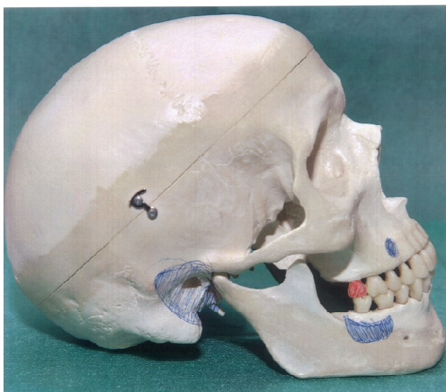
Slika 3. Odražena bol. Zubi zahvaćeni patološkim promjenama (crveno) i mjesto odražene boli (plavo).

Bolovi iz donjih sjekutića javljaju se u području brade. Bol iz gornjeg drugog i trećeg kutnjaka i donjih kutnjaka može se odraziti u područje temporalne kosti i mastoida. U području jezične kosti reflektirat će se bolovi iz donjih umnjaka. Refleks boli može se javiti i iz oboljelog zuba na druge zube iste, ali i suprotne čeljusti s tim da nikada ne prelazi medijalnu liniju. Prvi ili drugi donji pretkutnjak može izazvati reflektiranu bol u gornjem prvom ili drugom kutnjaku. Bolovi u nosnoj sluznici mogu biti uzrokovani patološkim promjenama prednjih gornjih zubi. Patološke promjene u gornjem očnjaku i u prvom pretkutnjaku mogu se prenositi u nazolabijalno i infraorbitalno područje. Patološke promjene u pulpnom tkivu drugog gornjeg kutnjaka i umnjaka mogu izazvati reflektirane bolove u mandibularnom području i u uhu, a katkad se bol osjeća i u dijelu gornjeg očnjaka iste strane.