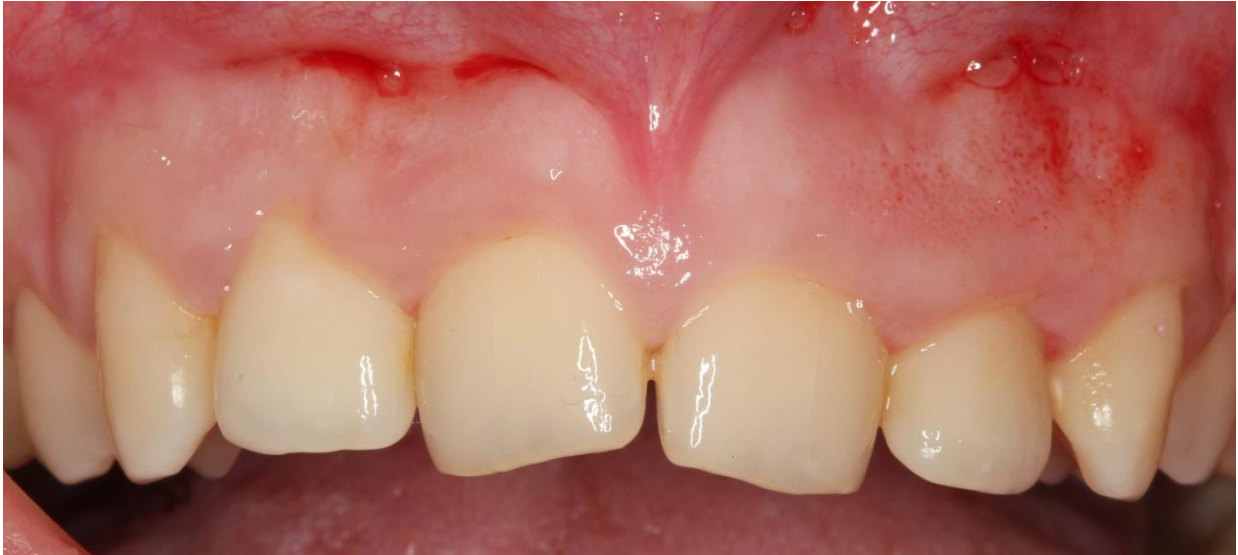
Slika 2. Klinička slika pacijentice prije apikalnog repozicioniranja režnja

Početna incizija može se napraviti kao što je prethodno opisana za gingivektomiju ili sulkularnom incizijom (31). Mjesto incizije ovisit će o širini keratinizirane gingive, položaju CCS-a, količini zuba koju trebamo prikazati i topografiji korijena zuba (10,31). Što je širina keratinizirane gingive veća, inciziju je potrebno pozicionirati više paramarginalno. S druge strane, što su koštani greben i CCS apikalnije od ruba gingive, rez se radi submarginalnije. Oblik reza mora biti polukružan kako bi imitirao zaobljeni oblik CCS-a jer time omogućujemo primarno cijeljenje interdentalnog prostora (31). Incizija kreće s bukalne strane interdentalne papile, iznad razine CCS-a, a ispod vrha papile. Nastavljamo je preko bukalnog dijela interproksimalnog koštanog grebena do bukalne gingive zuba gdje prelazi u režanj pune debljine. Interproksimalno papile ostaju potpuno očuvane i to nam omogućuje održavanje visine papile, kao i stabilizaciju režnja pri šivanju (slika 3.) (31). Bukalno se odigne režanj pune debljine do razine mukogingivnog spojišta i prikažu se CCS i koštani greben (31,43,48). U slučajevima kad je koštani greben posebice voluminozan, režanj se može odignuti nešto apikalnije (31). Po završetku oblikovanja kosti, režanj je potrebno repozicionirati do razine CCS-a i zašiti pojedinačnim šavovima, intrapapilarnim madrac šavom ili kontinuiranim intrapapilarnim šavom (slika 4.) (10,49,50). Šavovi se vade nakon tjedan dana, a rezultati se zahvata prate (slika 5.) (43,48).