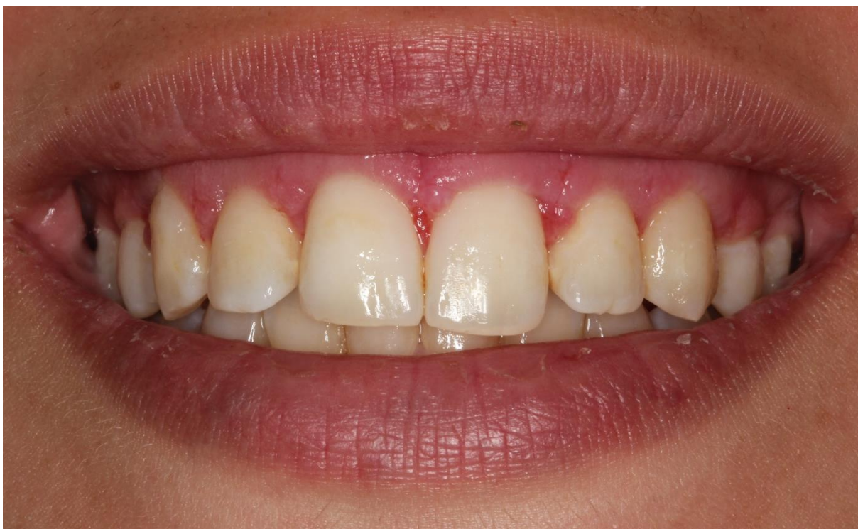
Slika 7. Klinička slika pacijentice tjedan dana nakon koštane resekcije i apikalnog repositioniranja režnja, fotografiju ustupila doc. dr. sc. Ana Badovinac