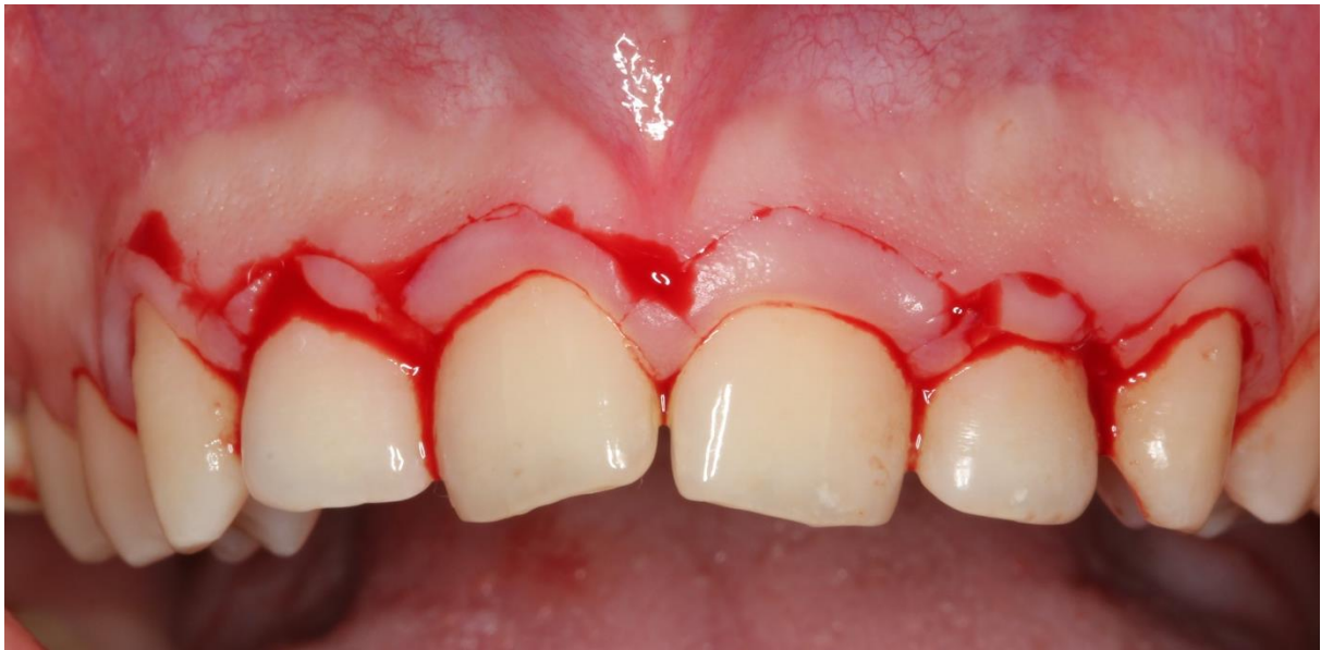
Slika 3. Preklapajuće paramarginalne incizije prije apikalnog repositioniranja režnja