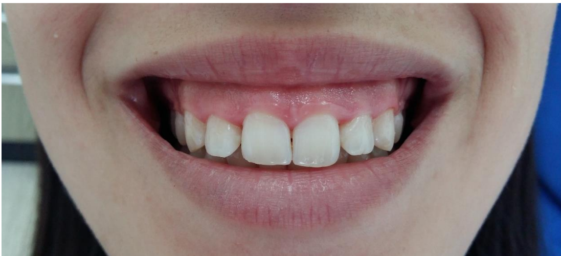
Slika 1. Gummy smile , fotografiju ustupila doc. dr. sc. Ana Badovinac

Gummy smile je pojam koji koristimo za osmijeh u kojem se prikazuje previše gingive iznad gornjih prednjih zuba (11). Zbog poremećenog odnosa roze i bijele boje u njemu, takav osmijeh ne izgleda harmonično (slika 1). Ova klinička slika zahvaća 10 % odraslih do četrdesete godine, a češća je kod žena (14 %), nego kod muškaraca (7 %) (7). Gummy smile može biti ograničen na prednji dio zubnog luka ili pak proširen na cijelu usnu šupljinu.