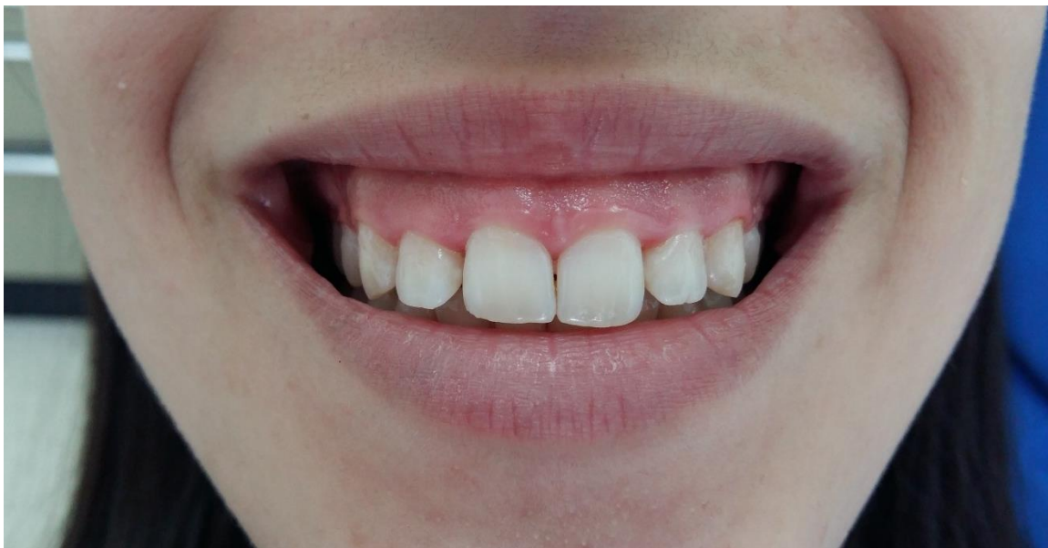
Slika 6. Klinička slika pacijentice prije koštane resekcije i apikalnog repositioniranja režnja