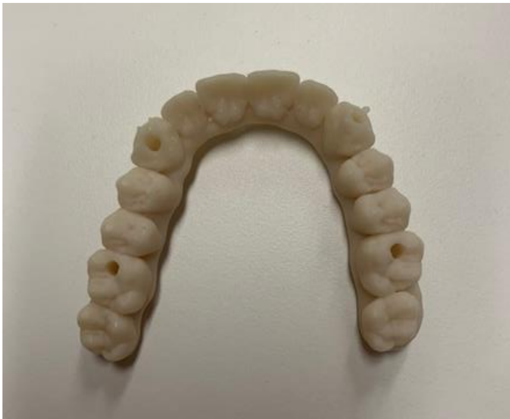
SLIKA 5. Privremeni most ispisan 3D tehnologijom. Preuzeto s dopuštenjem autora: izv.

Alharbi i sur. ispisivali su krunice SLA tehnologijom u 9 različitih smjerova i uz 2 vrste potpore (debeli i tanki tip) dobivši tako 18 grupa. Dokazali su da je odabir kuta ispisa ključan i određuje broj potpornih struktura. Kut od 90 stupnjeva pokazivao je najmanju pogrešku, ali u tom slučaju potporni pinovi su zauzimali cijelu lingvalnu plohu i nalazili su se blizu marginalne granice. Kut od 120 stupnjeva imao je pinove najudaljenije od kritičnog područja. Nije dokazana razlika u preciznosti između broja potpornih struktura, već je bitnija njihova raspodjela. Dokazano je da se veća potpora postiže uporabom većeg broja tankih pinova (47).