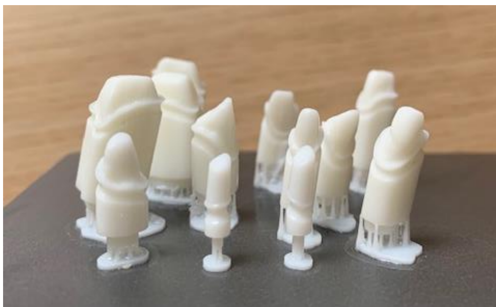
SLIKA 2. Bataljci ispisani 3D tehnologijom.