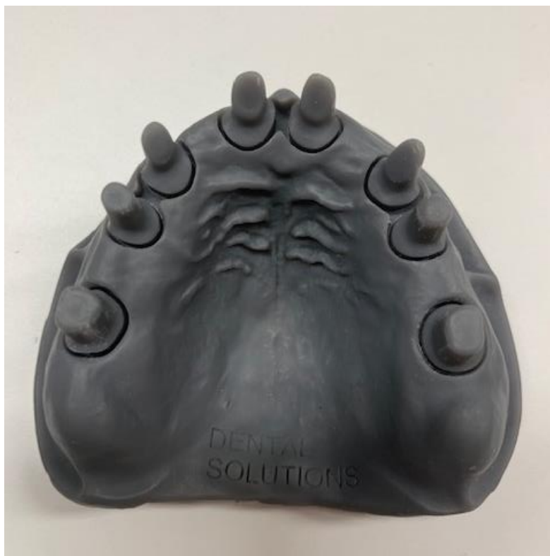
SLIKA 1. Radni model ispisan 3D tehnologijom.