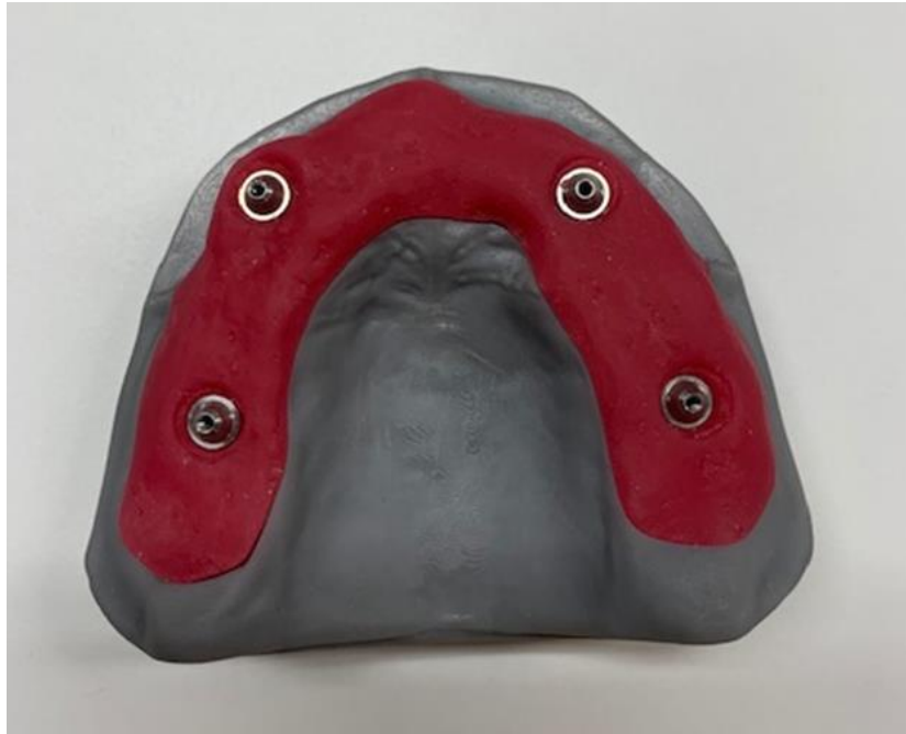
SLIKA 3. Kirurška šablona ispisana 3D tehnologijom.

Na preciznost kirurške šablone utječu brojni čimbenici, kao što su brzina lasera, kut nagiba, broj slojeva, skupljanje materijala između slojeva i količina potpornog materijala (29, 36).