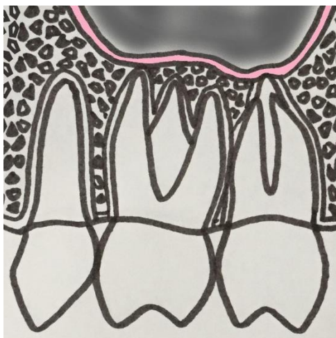
Slika 2. Mogući odnosi korijena zuba gornje čeljusti i maksilarnog sinusa

veća podložnost razvoju karijesa kroz vrijeme (20). Prema rezultatima studije koju su proveli Lee & Lee, najčešći uzročnik bio je drugi maksilarni molar (40,8 %), a zatim prvi molar (33,3 %) (22).