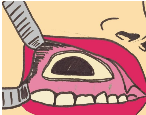
Slika 4. Caldwell-Luc - transoralni pristup maksilarnom sinusu

povećanje njenoga volumena kod bolesnika s Graves oftalmopatijom ili maksilarnoj arteriji kroz stražnju stijenku sinusa u slučaju jake epistakse. Transmaksilarni pristup omogućava resekcije živaca u slučaju neuralgije (ggl. sphenopalatinum i n. maxillaris) ili vazomotornog rinitisa (n. canalis pterygoidei) (19).