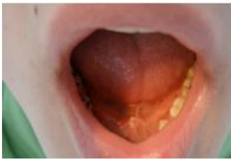
Slika 5. Sublingvalni kondilom. Preuzeto iz (5).