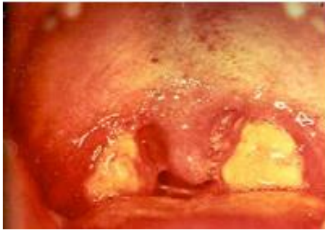
Slika 14. EBV – sindrom glandularne groznice. Preuzeto iz (5).