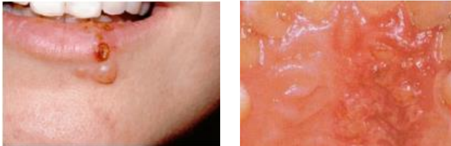
Slika 11. i 12. Herpes simplex infekcija. Preuzeto iz (5).

učestalost pojave ove promjene znatno smanjena zbog uporabe jednokratnih rukavica tijekom stomatološkog liječenja.