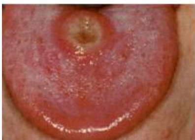
Slika 1. Ulcus durum na jeziku. Preuzeto iz (5).

Oko 50% bolesnika zaraženih sifilisom boluje i od neke druge spolno prenosive bolesti, od čega se u 25% radi o koinfekciji virusom humane imunodeficijencije (HIV-om). Takve istovremene infekcije znatno mijenjaju kliničku sliku sifilisa, kao i tijek i težinu bolesti (5).