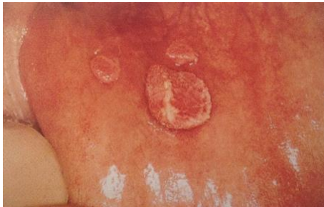
Slika 4. Šiljasti kondilomi na sluznici donje usne. Preuzeto iz (9).

uzrokovani karcinomi smješteni na dnu oralne šupljine ili na jeziku imaju lošiju prognozu u odnosu na druge lokacije (4).