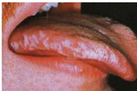
Slika 16. EBV – vlasasta leukoplakija. Preuzeto iz (5).