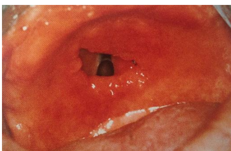
Slika 2. Guma na nepcu. Preuzeto iz (9).