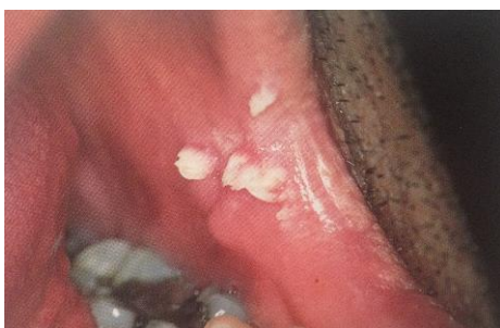
Slika 6. Vulgarna veruka. Preuzeto iz (9).