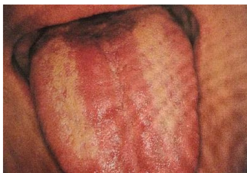
Slika 17. Eritematozna kandidijaza. Preuzeto iz (9).

Ono zbog čega nam je oralna kandidijaza zanimljiva u kontekstu spolno prenosivih bolesti jest činjenica da je često uzrok recidivirajuće vulvovaginalne kandidijaze stečene oralno-genitalnim načinom prijenosa infekcije. Objašnjenje nalazimo u dvama mehanizmima. Prvi je infekcija iz usta zaraženog partnera, a drugi je prisutnost sline u genitalnom području koja mijenja lokalne uvjete u vulvi i vagini (3, 4).