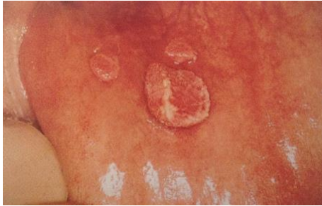
Slika 4. Šiljasti kondilomi na sluznici donje usne. Preuzeto iz (9).

uzrokovani karcinomi smješteni na dnu oralne šupljine ili na jeziku imaju lošiju prognozu u odnosu na druge lokacije (4).