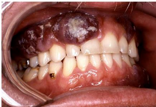
Slika 9. HIV – Kaposijev sarkom. Preuzeto iz (5).