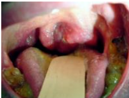
Slika 8. HPV-om uzrokovani karcinom grla. Preuzeto iz (5).