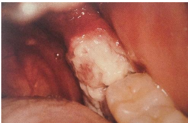
Slika 10. Non – Hodgkin limfom. Preuzeto iz (9).