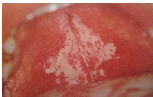
Slika 18. Pseudomembranozna kandidijaza. Preuzeto iz (9).