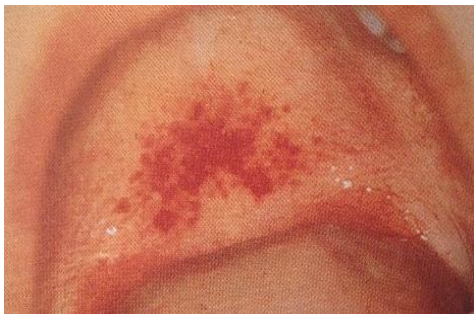
Slika 15. Infektivna mononukleoza – petehije na nepcu. Preuzeto iz (9).