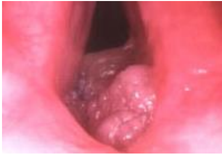
Slika 7. Laringealna papilomatoza. Preuzeto iz (5).