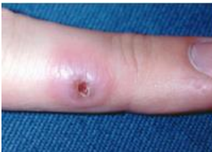
Slika 13. Herpetična zanoktica. Preuzeto iz (5).