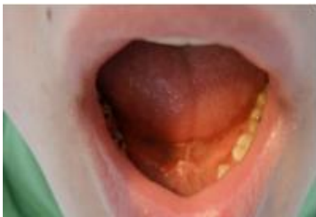
Slika 5. Sublingvalni kondilom. Preuzeto iz (5).