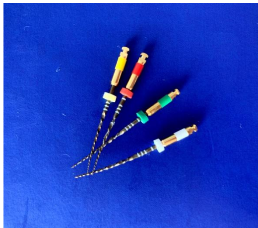
Slika 3. WaveOne Gold instrumenti (Dentsply Sirona, Ballaigues, Švicarska)