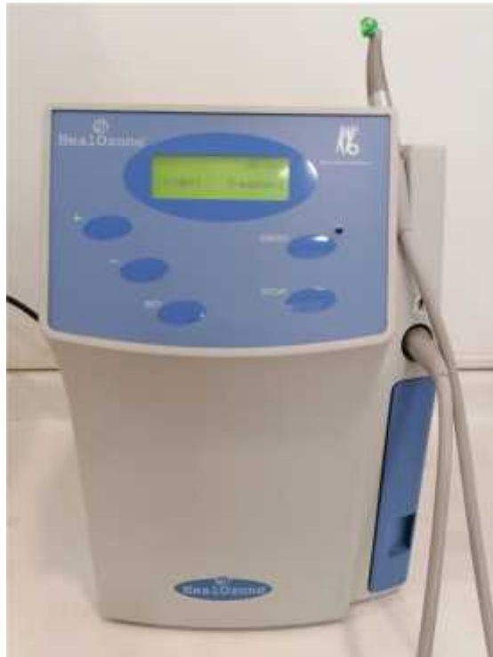
Slika 1. Generator ozona HealOzone (KaVo Dental GmbH, Germany).