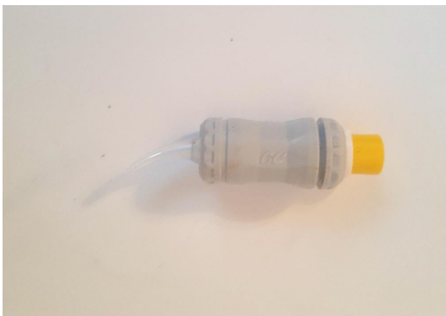
Slika 2. Staklenoionomer u obliku kapsule (Fuji IX GT; GC, Tokyo, Japan)