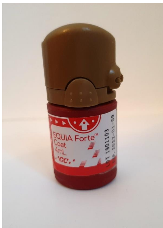
Slika 4. Zaštitini premaz (Equia Forte Coat; GC, Tokyo, Japan)

Poznato je da je zbog procesa stvrđivanja staklenoinomera prilikom postavljanja njihova otpornost na abraziju slaba u usporedbi s potpuno stvrdnutim cementom (84). Metalom ojačani staklenoinomeri (83) i staklenoinomeri s visokim omjerom praha i tekućine pokazali su značajno smanjenje trošenja pri abraziji (85). Dodatno sredstvo za povećanje otpornosti na abraziju je i koncept premaza. U novije vrijeme je česta uporaba, G-Coat Plus (GC Corp, Japan) u kombinaciji staklenoinomera visoke viskoznosti, Fuji IX ili EQUIA Forte Fil u kombinaciji s Equia Coat (GC Corp) (Slika 4.). Pokazalo se da je nanošenje prethodno opisanog premaza povećalo čvrstoću staklenoinomernog cementa i povećalo njegovu otpornost na abraziju. Vjeruje se da smola može prožeti površinu staklenoinomera i ispuniti pukotine i poroznosti (86).