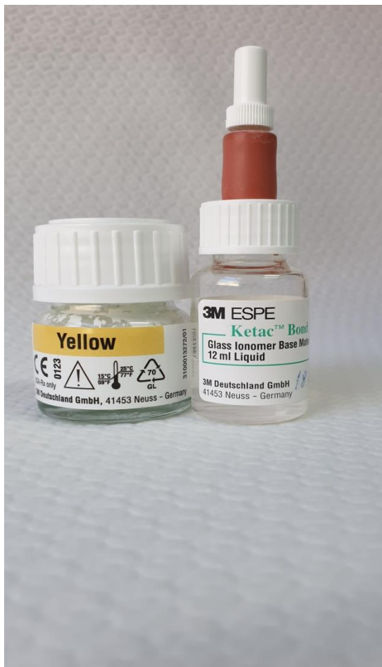
Slika 1. Staklenoionomer u obliku praha i tekućine (Ketac Bond; 3M, Neuss, Njemačka).