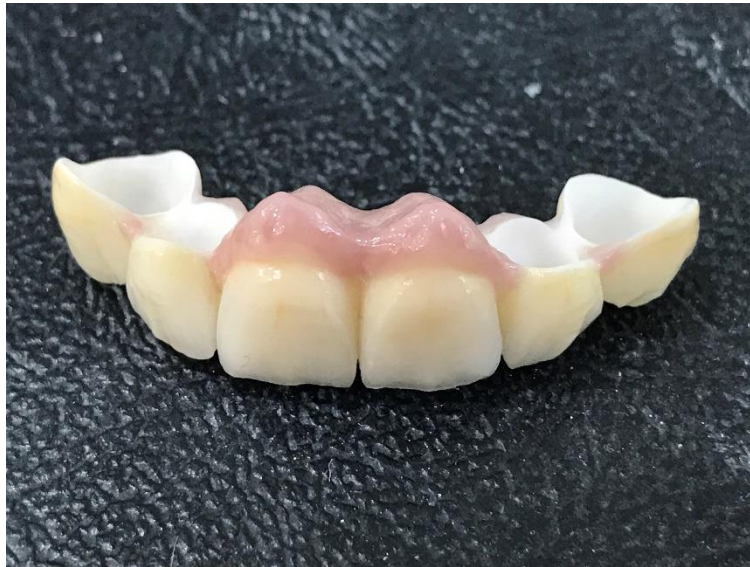
Slika 3. Dvoslojni keramički sustav

Ovo navodi na zaključak da bi otporniji i žilaviji materijal osnovne konstrukcije mogao uspješno spriječiti širenje pukotina koje potječu od slabijega obložnoga sloja (14).