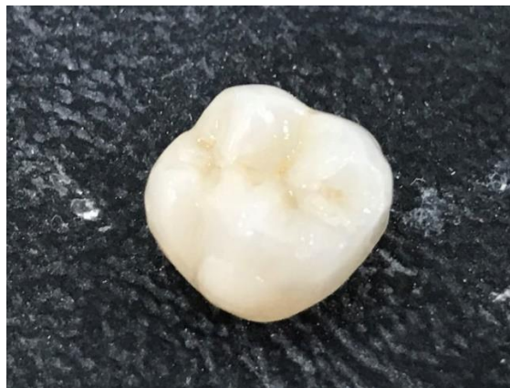
Slika 2. Potpuno keramička krunica

Kako bi izbjegli komplikacije vezane uz dvoslojni sustav istraživači i kliničari, podupirani dentalnom industrijom, okreću se sve više monolitnim sustavima. Radi se o nadomjescima izrađenim u jednom komadu i od jednog materijala. Najčešće se u monolitnom obliku koriste litij-disilikatna staklokeramika i cirkonij-oksidge keramika. Iako su oba materijala vrlo kvalitetni protetički materijali, imaju ipak određene nedostatke zbog čega se koriste u različitim regijama zubnoga niza. Tako litij-disilikatna keramika (Slika 2.) zbog boljih estetskih svojstava češće ide u prednji segment zubnog niza (tehnika slojevanja) iako se može koristiti i u stražnjoj regiji (tehnika bojanja), dok je cirkonij-oksidge keramika kao najotporniji keramički materijal i zbog nešto lošijih optičkih svojstava idealna za stražnju regiju (10).