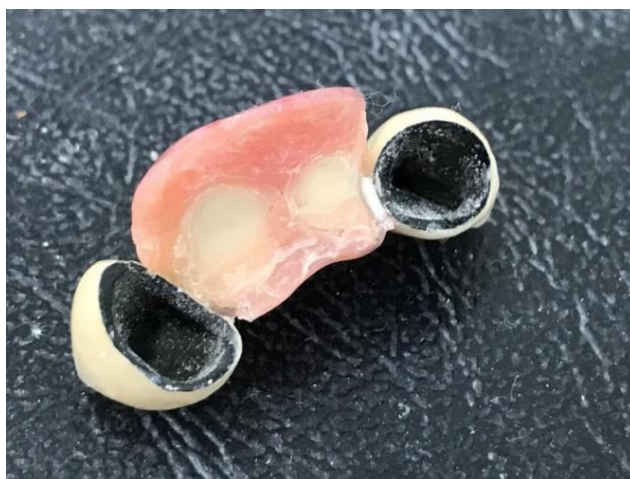
Slika 1. Metal-keramički most

Nedostaci koji diskreditiraju ove materijale i tehnologiju su: siva prosijavanja u vratnom dijelu nadomjestka zbog metalne osnovne konstrukcije, potencijalni lom obložne keramike zbog neujednačenih termičke koeficijenata istezljivosti (KTI) dvaju materijala u dodiru i pogrešaka u izradi nadomjestka te sve veća učestalost alergija u suvremenom društvu. Poznato je da je glavni alergen u dentalnoj protetici nikal, a on je sastavni dio mnogih dentalnih legura jer osigurava bolju ljevljivost i antikoroziivnost.