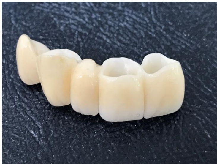
Slika 4. Most od monolitne cirkonij-oksidne keramike

Ipak, litij disilikat u prednosti je zbog veće translucencije, tj. boljih optičkih svojstava koja prirodnije imitiraju zubnu caklinu (17).