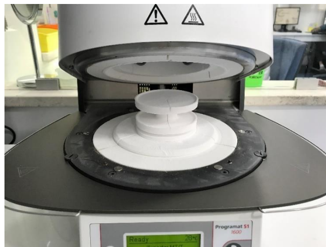
Slika 7. Radno polje peći za sinteriranje

CAD/CAM tehnika nerijetko se u zadnje vrijeme a posebno kod većih protetskih rehabilitacija povezuje s tehnikom naziva digital smile design (DSD). DSD je višefunkcionalno softversko rješenje koje poboljšava komunikaciju između stomatologa i tehničara, omogućuje bolju dijagnostiku te predviđanje konačnog rezultata. Ipak, zbog potrebne dodatne opreme, prostora, znanja i kliničkog iskustva ovakav princip rada nije još uvijek integriran u svakodnevnu praksu (21).