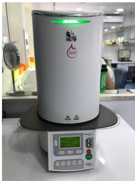
Slika 8. Peć za sinteriranje