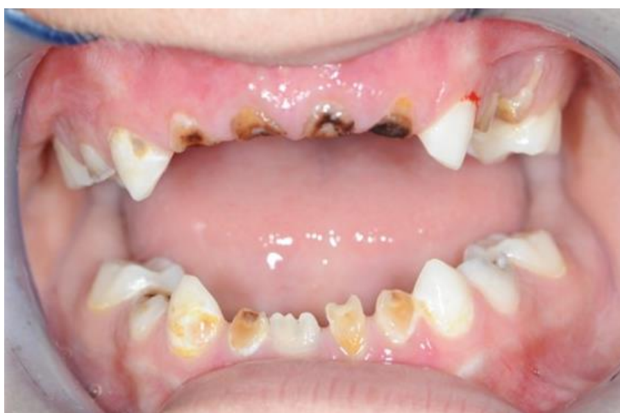
Slika 6. Rani dječji karijes.