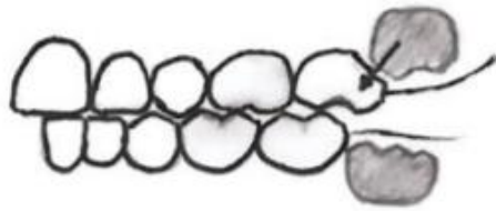
Slika 3. Ektopično nicanje prvog gornjeg trajnog kutnjaka