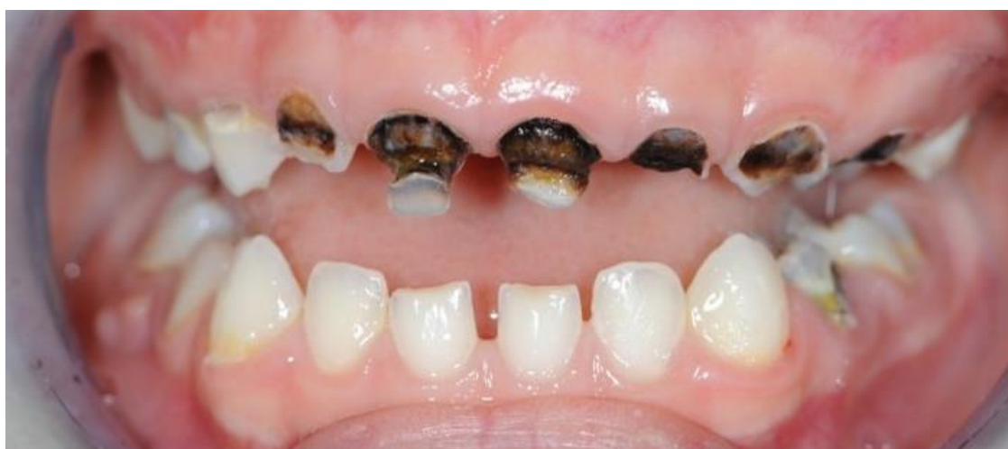
Slika 5. Rani dječji karijes.