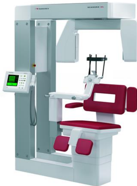
Slika 2: CBCT.

Računalni tomograf s konusnim snopom (CBCT) je radiološki uređaj koji se sastoji od izvora konično usmjerenih rendgenskih zraka koje se nakon prolaska kroz objekt registriraju na dvodimenzionalnom detektoru. Dvodimenzionalni detektor mjerenja pretvara ionizirajuće zrake u električne signale, nakon čega računalo na temelju dobivenih podataka sintetizira sliku. Nju čine matriks slike i voksel (volumni element), unutar kojeg se analizom apsorpcijskih značajki stvara piksel (element slike) (3). Računalna tomografija s konusnim snopom (CBCT) daje neiskrivljenu trodimenzionalnu informaciju anatomskih struktura i patoloških promjena u području glave i vrata s nižom učinkovitom dozom zračenja od računalne (7).