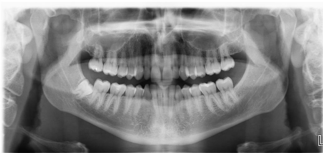
Slika 1: Ortopantomogram.