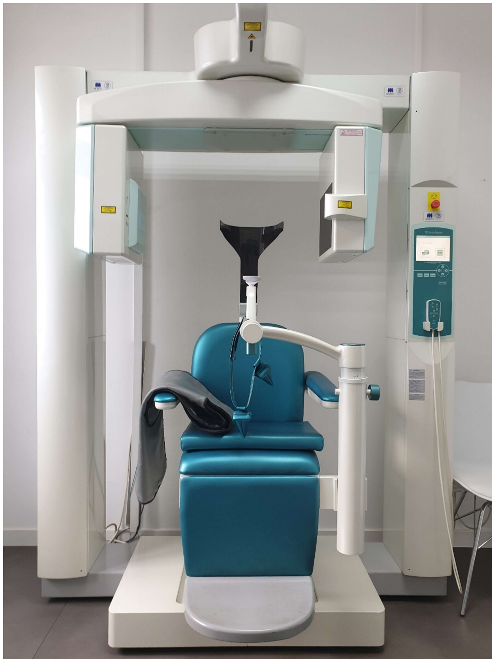
Slika 1. CBCT uređaj

CBCT omogućuje i prikaz kosih, zakrivljenih te poprečnih presjeka (5,12,13,14). Bitna funkcija koja omogućuje selektivni prikaz voksela je rendering . Dijeli se na direktni, kod kojeg se proizvoljno označi vrijednost vokselu ispod i iznad koje su ostale vrijednosti isključene te na indirektni, kod kojeg se postiže takozvana segmentacija kojom se prikazuje određena gustoća vokselu u cjelokupnom prikazu. Svi podatci dobiveni snimanjem dolaze u standardiziranom (DICOM) formatu, što pojednostavljuje telekomunikaciju i omogućuje kompatibilnost s drugim softverima (7).