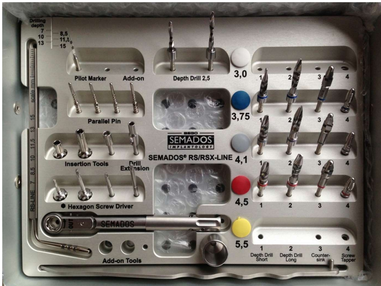
Slika 3. Set za ugradnju implantata.