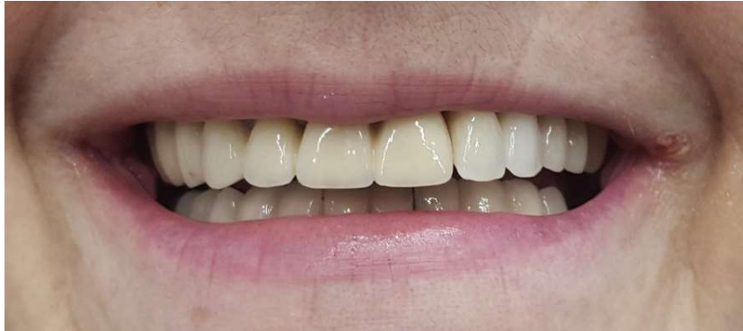
Slika 4. Most nošen implantatima (gore lijevo).

laterotruzija). Poželjni su istovremeni kontakti na protetskom nadomjestku na implantatima i u lateralnom segmentu (68). U svakom slučaju, svi prijedlozi temeljeni su na konceptu okluzije koja štiti implantat, a čiji je cilj ostvariti okluziju vođenu očnjakom, ukoliko je očnjak očuvan (92). Ukoliko postoji zadovoljavajuća širina alveolarnog grebena, linearni raspored implantata stvara dobre okluzalne i optimalne estetske preduvjete (68).