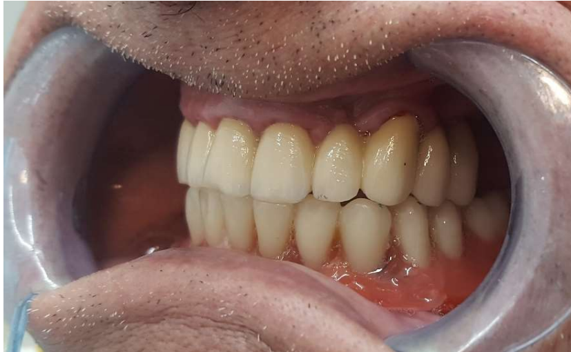
Slika 5. Donja pokrovna proteza na dva lokatora.

prednosti bitno je spomenuti kako je kod ovakvih radova značajan i financijski čimbenik; mobilnoprotski radovi jeftiniji su od fiksnoptetskih te se pacijenti često upravo iz tog razloga odlučuju na takvu vrstu terapije. Broj implantata potrebnih za RP-4 tip implantoprotetskog nadomjestka poklapa se s brojem potrebnim za potpuno fiksni rad, dok je za RP-5 tip potreban manji broj implantata, najčešće dva (44).