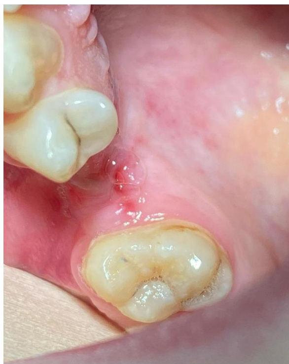
Slika 1. Klinički prikaz pozitivnog Valsavinog testa.

Test se izvodi na način da liječnik pritisne nosnice pacijenta tako da kroz njih ne može izlaziti zrak te kaže pacijentu da lagano puhne na nos. Lagano puhanje je potrebno naglasiti zbog toga što ukoliko nije bila prisutna komunikacija, a na dnu alveole je tanka netaknuta sluznica, prejakim puhanjem povećava se rizik od stvaranja komunikacije. Nakon toga promatramo alveolu i ukoliko je test pozitivan, primijetit ćemo stvaranje mjehurića zraka pomiješanih s krvlju. Također se čuje i piskutavi zvuk koji nastaje zbog prolaska zraka kroz fistulu u usnu šupljinu (8, 12, 13).