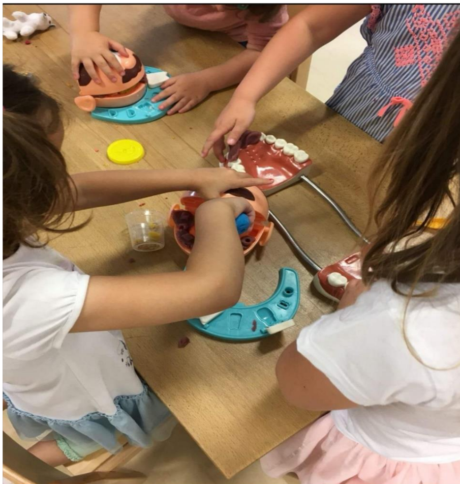
Slika 2. Radionica Projekta Zubić u DV

U program su uključeni studenti svih godina Stomatološkog fakulteta i na taj se način ujedno pruža mogućnost studentima da usvoje nove komunikacijske vještine nužne u radu s djecom.